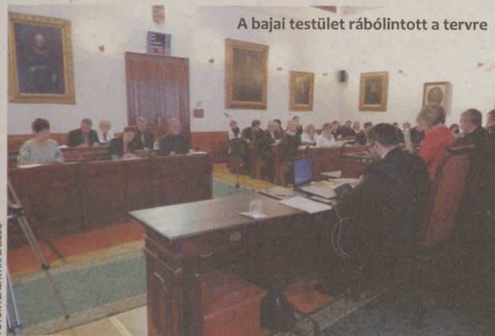
A bajai testület rábólintott a tervre

Az ellátáshoz szükséges ingatlant a várostól veszi meg az egyház, amelyre a tervek szerint további 4-5 millió forintot költenek. Az épület jelenleg a Baja Marketing Kft. tulajdona. Bócsa Barnabás igazgató kérdésre válaszolva elmondta: az utóbbi években egyre kisebb igény mutatkozott a teremre, állaga pedig folyamatosan romlik. Éppen ezért jó, hogy az új tulajdonos majd felújítja, s olyan szolgáltatást nyújt, mellyel úrt tölt be a városban. G. ZS.