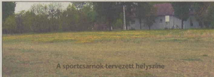
A sportcsarnok tervezett helyszíne