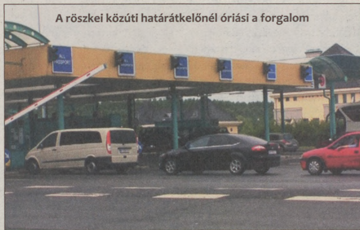
A röszkei közúti határátkelőnél óriási a forgalom

ÚTLEZÁRÁSOK Június 25-26-án, a XI. Mogyi Triatlón versenyen az alábbi útlezárások várhatóak a város területén.