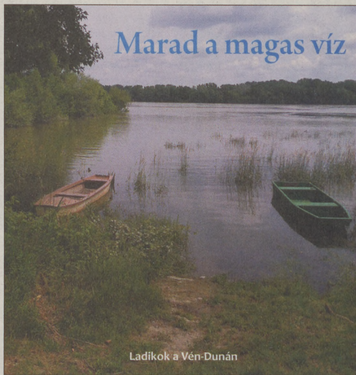
Ladikok a Vén-Dunán

DUNA Továbbra sem fogadta kegyeibe a strandolókat a folyó. Június 6-án 6 méter alatt tetőzött a bajai szakaszon, de azóta is magas a víz. Most éppen apad, de 500 centi körül marad és péntektől ismét árad. Így hiába ácsingóznak dunai zátonyokra a fürdőzők, még a Sugó homokos strandja sem bukkan elő. Pedig a víz melegszik, június 15-én reggel 19,6 fokot mértek. A hullámtéri és ártéri nyaralókat jelenleg nem fenyegeti elöntés. G. ZS.