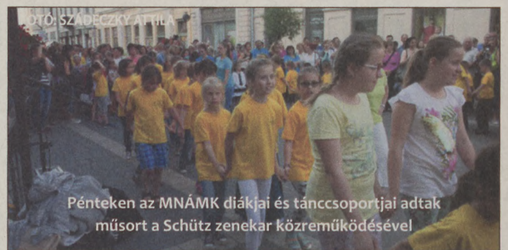
Pénteken az MNÁMK diákjai és tánc csoportjai adtak műsort a Schütz zenekar közreműködésével

Nemzetek tánca Június 24. (péntek), 19 óra: Szeremlei Néptáncegyüttes és Danubia Alapfokú Művészeti Iskola Nagybaracscai Gyermekek Néptánc csoportjának felnőtt tánc háza (kísér: Bácska Banda). Július 1. (péntek), 19 óra: Bunyevacka „Zlatna Grana” (kísér: Cabar zenekar). Július 15. (péntek), 19 óra: Görög tánc ház (kísér: Permessos zenekar). Július 22. (péntek), 19 óra: Stúdió 2000 Tánc, Sport Egyesület (latin és standard táncok). Július 29. (péntek), 19 óra: Sugovica Tánc kör (kísér: Brača Barič).