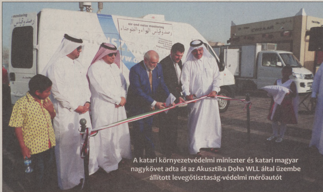
A katarai környezetvédelmi miniszter és katarai magyar nagykövete adta át az Akusztika Doha WLL által üzembe állított levegőtisztaság-védelmi mérőautót