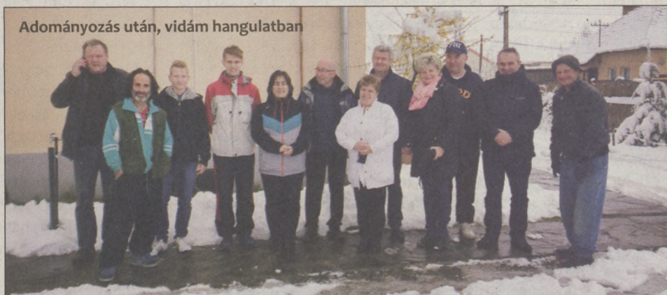
Adományozás után, vidám hangulatban

gyarapodott az általa működtetett két épület. A bajai küldöttség programja csütörtökön Erdőszentgyörgyön folytatódott, a Szent György Napokon. Itt a bajai halászlé kapta a főszerepet. Miközben főtt a bográcokban a hungarikummá lett, kultikus éték, Pump Károly fotóművész kiállítását megtekintve a halászléfőző