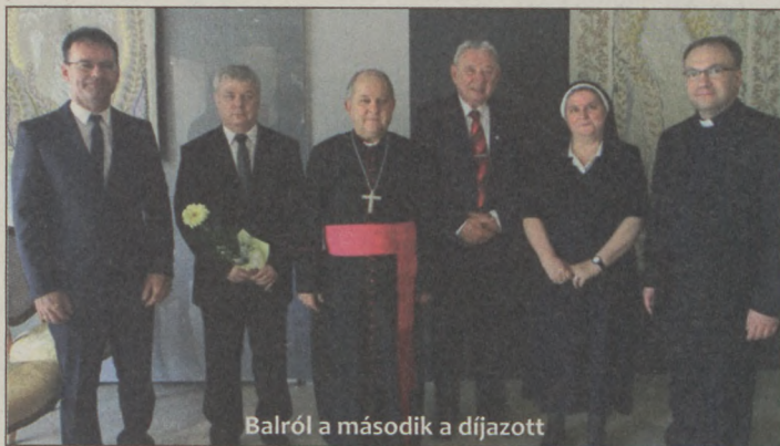
Balról a második a díjazott