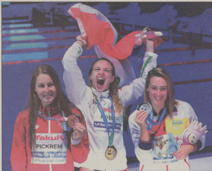
Hosszú Katinka a női 400 méteres vegyesúszás eredményhirdetésén

SÁRKÁNYHAJÓ Fadd-Domboriban rendezte meg június 24-én a Magyar Sárkányhajó Szövetség a III. Magyar 10. személyes bajnokságot. Nem volt korosztályos bontás, a bajai csapat együtt versenyzett a premier mezőnyvel.