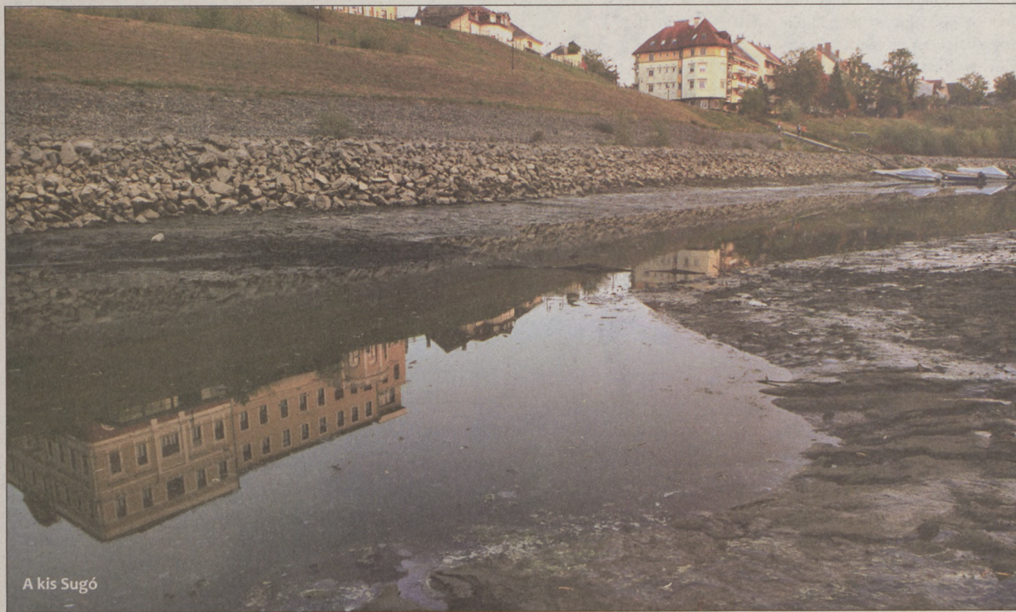
A kis Sugó