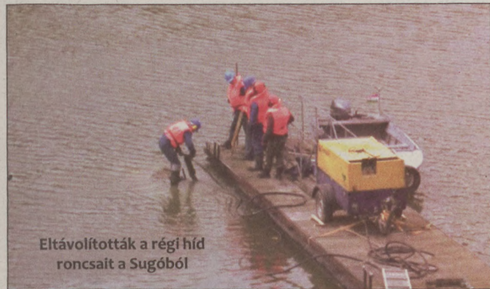
Eltávolították a régi híd roncsait a Sugóból

A Petőfi-szigetet a várossal összekötő régi hidat 1982-ben bontották le, a munka akkor részben robbantással történt. A hídpillér alapok mederben lévő szerkezeti elemeit azonban nem sikerült maradéktalanul eltávolítani az akkori kivitelezőnek, ezért volt szükség a munkára, olvasható a vízügyi igazgatóság közleményében.