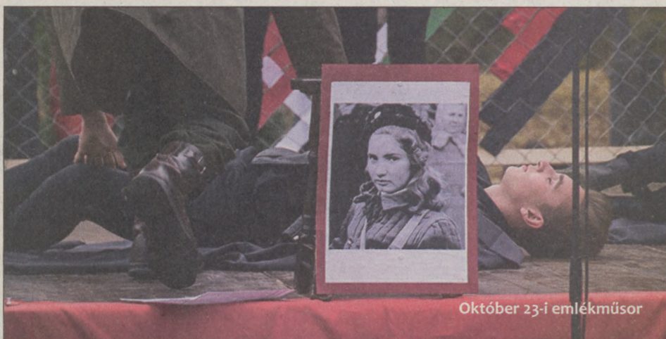
Október 23-i emlékműsor