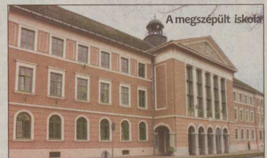
A megszüpült iskola

A jubileumi év alkalmából látványos fali dekorációt készítettek a diákok, utalva az intézmény múltjára és az iskola nyújtotta lehetőségekre. A tervek szerint hamarosan közművelődési képzésekre is jelentkezhetnek a fiatalok.