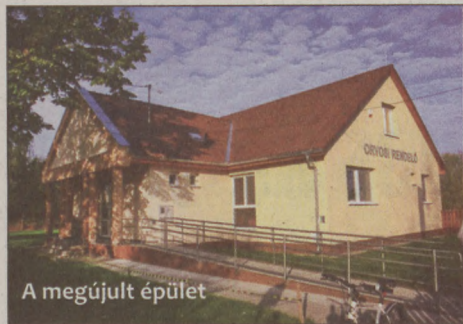
A megújult épület

vosoknak –, a környezetet is megszépítettük. A mellette lévő játszótér segíthet a gyermekek számára a várakozási időben. A Mártonszállási útról ide vezető utat is kiszélesítették, padkázták, így a megközelítés is könnyebbé vált.