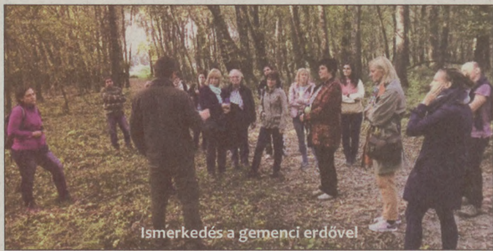
Ismerkedés a gemenci erdővel

Kormányzati támogatásból szépülhetnek a települések: Katymár, Gara és Bácsbokod sikeresen pályázott a Belügyminisztérium kiírásán: közel 50 millió forintból fejlődhetnek tovább.