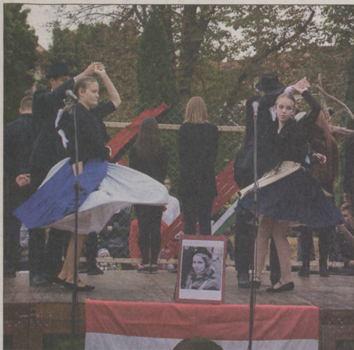
Az elmélyült emlékezést segítette a Szent László ÁMK középiskolás művészeti csoportja műsora (balra), majd több intézmény, civil és '56-os szervezet koszorúzott az emlékműnél (jobbra)