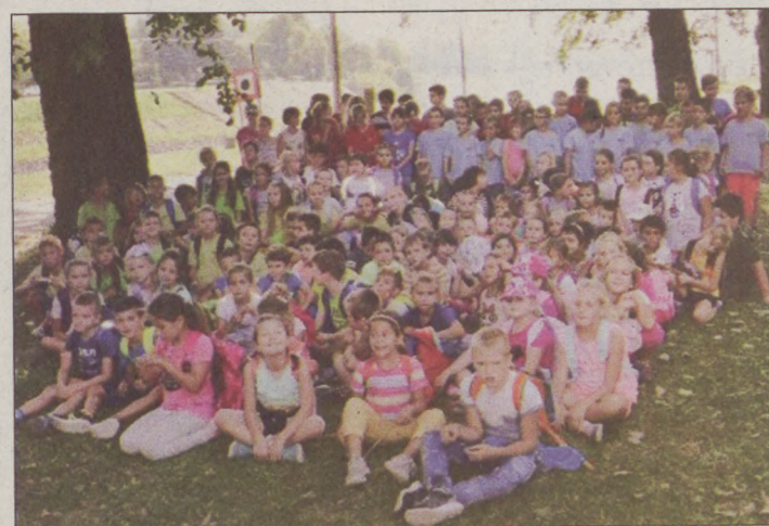
138 diák a szabadban tanult, kirándult és játszott

KIRÁNDULÁS Szeptember végén egy szép, napsütéses pénteki napon útra kelt a Sugovica Sportiskolai Általános Iskola Szent Antal utcai épületének alsó tagozata. A 138 kisgyerek tanítóik kíséretében városnéző kisonatozáson, dunai hajózáson, skanzen látogatáson vett részt. A programokon túl bőven volt lehetőség a szabad, önfelelt játéokra. Tanulóink fáradtan, de sok új élménnyel és ismerettel gazdagodva tértek vissza az iskolába. A megvalósításhoz szükséges anyagi támogatást köszönjük a Baja Város Önkormányzat Köznevelési, Ifjúsági és Sport Bizottságának. A TANÍTÓ NÉNINK