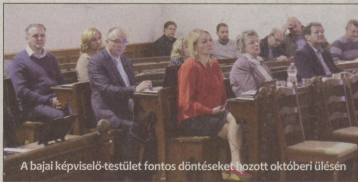
A bajai képviselő-testület fontos döntéseket hozott októberi ülésén

A 2016-ban útjára indított program lényege a munkaerőpiac fejlesztése, a kereslet és kínálat összehangolása, a hátrányos helyzetű munkaerőpiaci csoportok felzárkóztatása és versenyképességének erősítése. Legfontosabb célkitűzés az inaktív, nyilvántartásokban nem szereplő személyek megszólítása, munkaerőpiaci piaci helyzetének és lehetőségeinek javítása, személyes mentorálás által. A Szentháromság tér 11. szám alatt megnyíló paktumirodában minden érdeklődő számára további információkkal szolgálnak a programról. S. B.