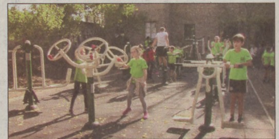
A gyerekek rögvest kipróbálták az új eszközöket

Az előző években sok felújítás történt, a nyílászáró- és a