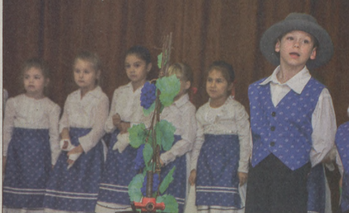
A kisdíákok is felléptek