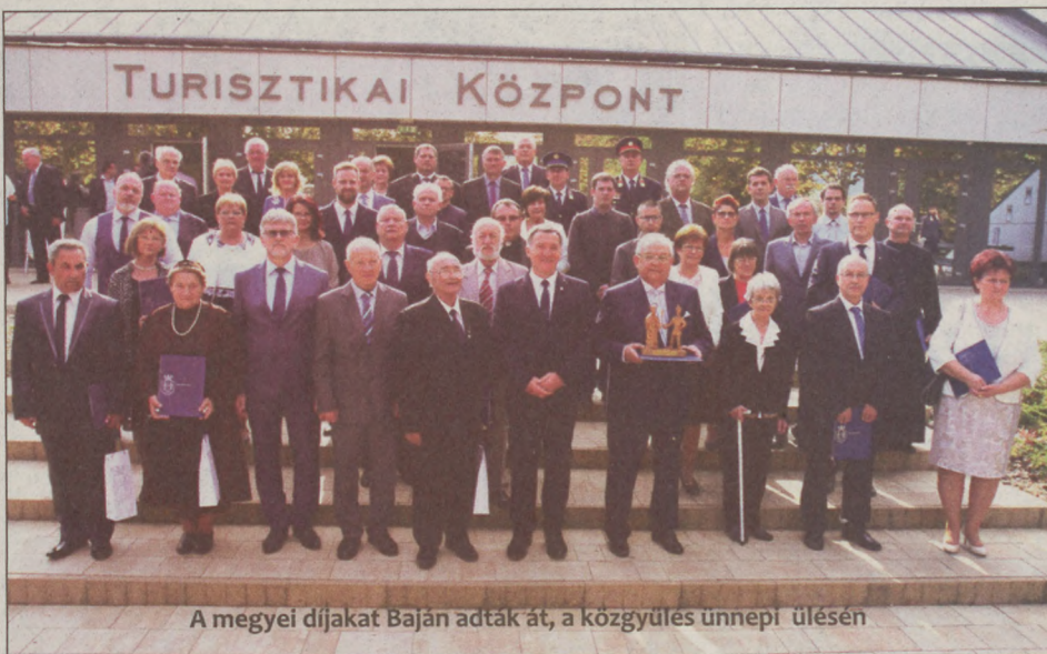
A megyei díjakat Baján adták át, a közgyűlés ünnepi ülésén

Bács-Kiskun megye közgyűlése kapcsán kiemelte: az a feladatuk, hogy a valamennyi lakos találja meg a számítását. „Legyen az a hely, ahol jó élni! 63 milliárd forintos fejlesztés zajlik a megyében, 400 pályázat megvalósításában segítünk. Minden településen van beruházás, ide tartozik például a bajai piac felújítása is. Egységes, pozitív jövőképet szeretnénk mindenki számára Bács-Kiskunban!”