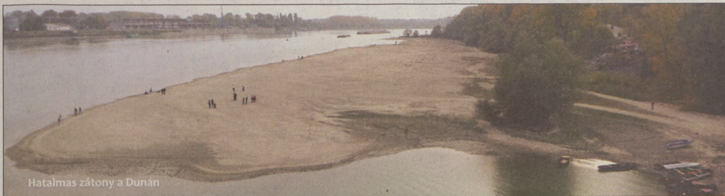
Hatalmas zátony a Dunán