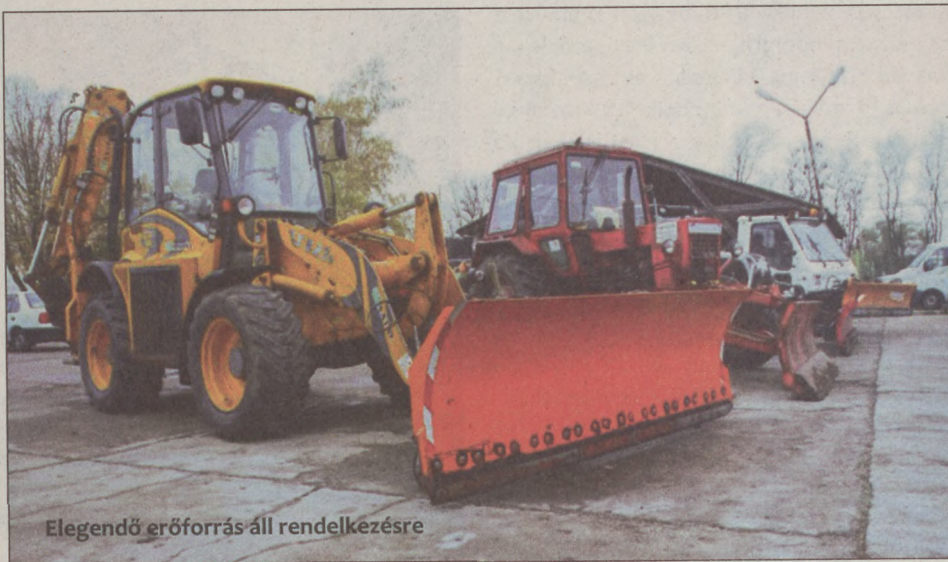
Elegendő erőforrás áll rendelkezésre

Az 51-es és az 55-ös főút síkosság-mentesítése a Magyar Közút Zrt. hatáskörébe tartozik, a többi közutat és közterületet helyileg kezelik. – November 15-én megkezdődött a téli felkészülés, a síkosság-mentesítési tervet aktualizáltuk. Ez tartalmazza a technikai felkészülést a hóeltakarításra, a jégbordák és a jégfelület eltávolítására. Ugyanakkor a város több pontjára is kiszállítjuk azokat a tároló edényeket, amelyekbe dunai homokkal összekevert sót teszünk. A későbbiekben ezzel szórjuk fel az utakat. Teljes mértékben fel-