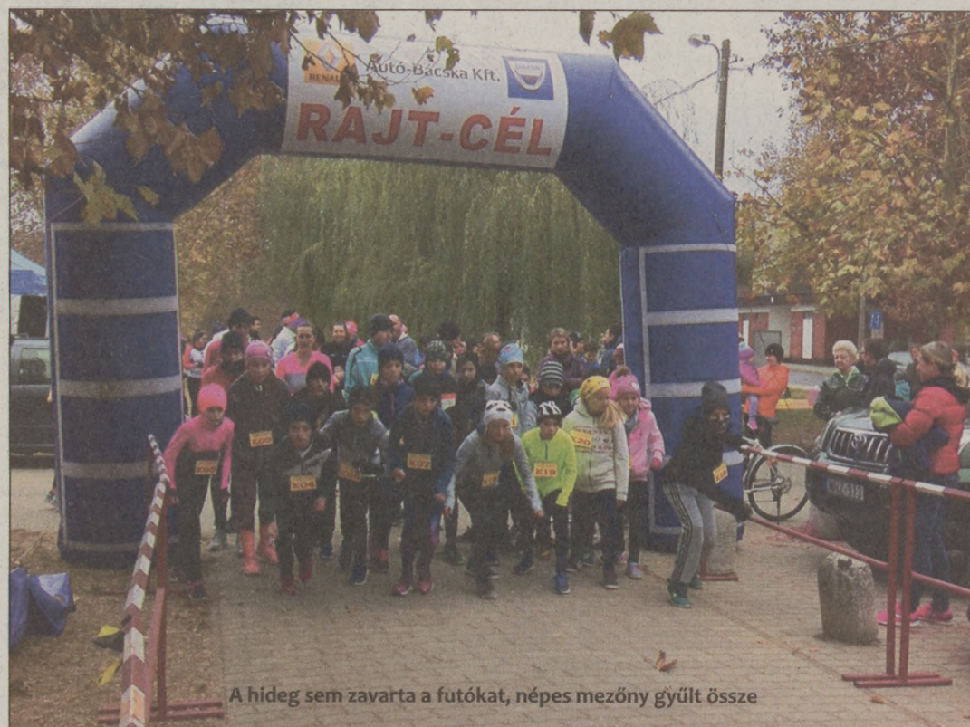
A hideg sem zavarta a futókat, népes mezőny gyűlt össze

VÍZILABDA A Petőfi-szigeti sportuszodában a Sugovica VSE ifi csapata a Dél-Kelet Magyarországi bajnokságban a Sárospatak ellen 10-7-re nyert, míg a Nyíregyházával döntetlent játszott (11-11). Az SVSE (1-1 győzelem és döntetlen, valamint 2 vereség) a 8 csapatos bajnokságban a tabella ötödik helyén áll. A harmadik fordulót január 12-én, Békéscsabán rendezik.