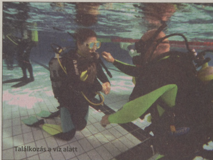
Találkozás a víz alatt

– A Havária Egyesületből még két bűvár vesz részt CMAS fogyatékos-bűvár asszisztensképzésen, és indulhat a munka. Jövőre felvennénk a