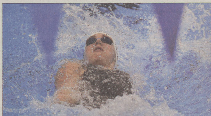
Hosszú Katinka jó formában van (korábbi felvétel)