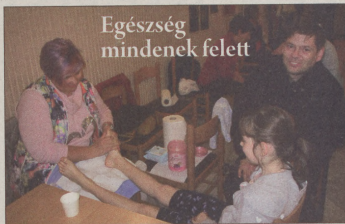
Egészség mindenek felett