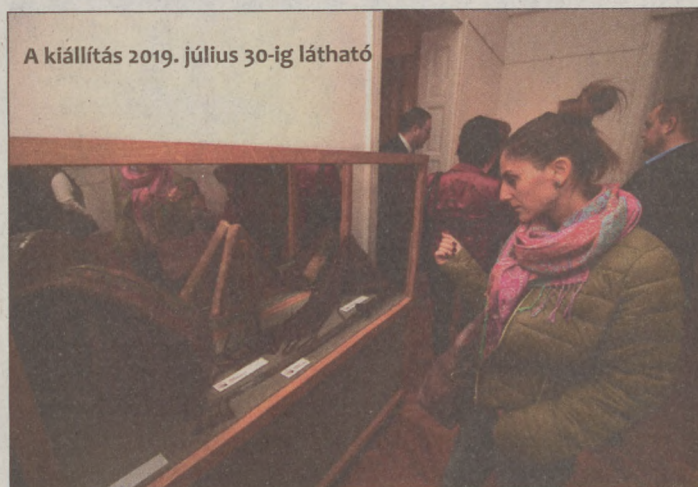
A kiállítás 2019. július 30-ig látható