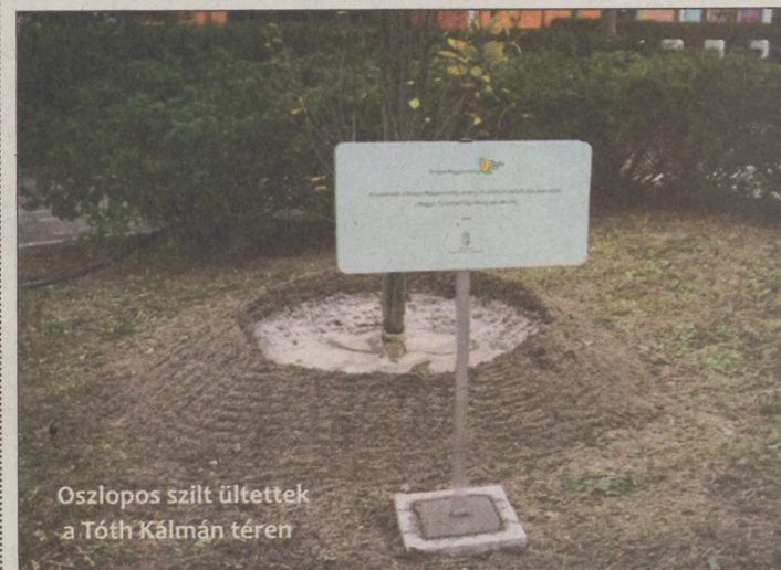
Oszlopos szilvát ültettek a Tóth Kálmán téren