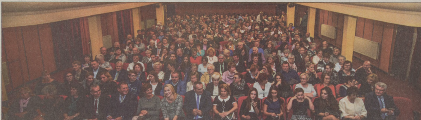
Teltház: óriási siker volt az idei Csodálatos Baja záró rendezvénye, A cigánybáró