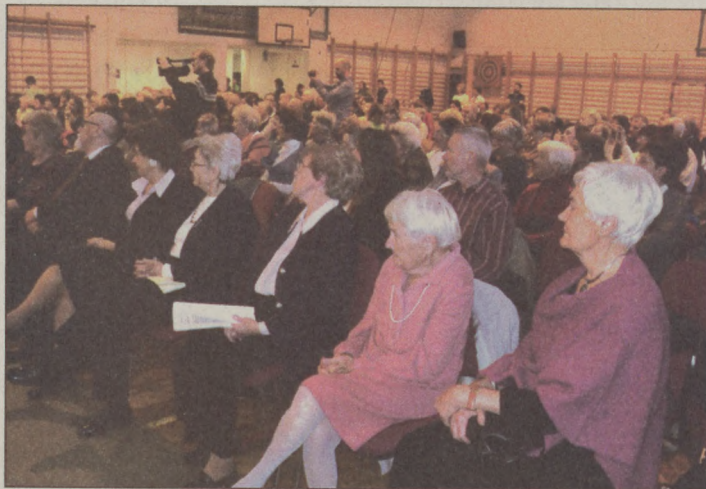
Sok egykori pedagógus ment el a jubileumi ünnepségre

OKTATÁS Zsúfolt nézőtér, bensőséges hangulat, változatos műsor, értékes visszaemlékezések sora jellemezte november 17-én a bajai Eötvös József Általános Iskola fennállásának 60. évfordulója tiszteletére rendezett ünnepséget.