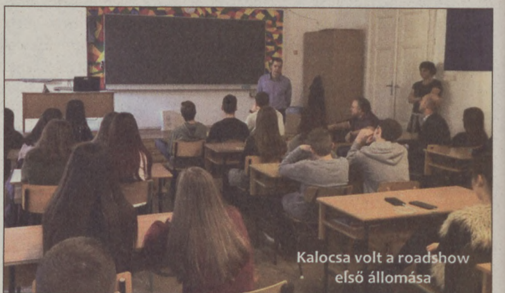
Kalocsa volt a roadshow első állomása