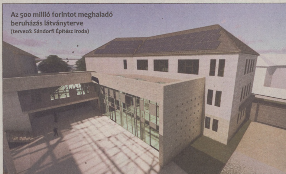
Az 500 millió forintot meghaladó beruházás látványterve (tervező: Sándorfi Építész Iroda)

megújul. A testnevelést udvari fitnesspark, többsávos futópálya, valamint egy többfunkciós sportpálya segíti. A munkálatok egyik célkitűzése, hogy az iskolaépület, valamint az