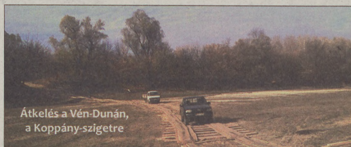
Átkelés a Vén-Dunán, a Koppány-szigetre