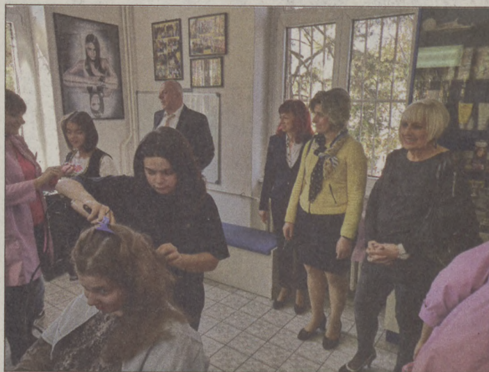
Szakmákat is tanulnak a jagodinai intézményben, a bajai küldöttség a fodrászműhelybe is ellátogatott

A megbeszélések során megegyeztek, hogy az intézmények dolgozói kölcsönös látogatásokon vesznek részt, ismerkedve a két iskolában zajló munkával. A bajai főiskola pedagógiai szakirányú jagodinai hallgatói pedig gyakorlatra mehetnek az EGYMI-be. – A jagodinai iskolában azt tapasztaltuk, hogy példamutató módon foglalkoznak a gyerekekkel. Az intézmény saját pékségében sütik a kenyeret, műhelyekben szakmát tanulnak, és mindenből igyekeznek kihozni a legtöbbet, amit a képességei megengednek – mondta az alpolgármester. A látogatás során további együttműködésekről is egyeztettek.