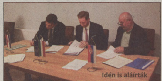
Idén is aláírták