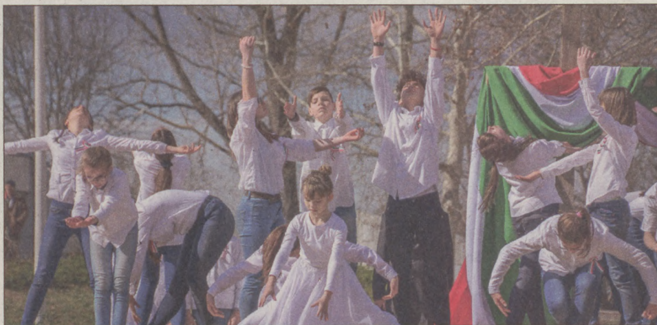
Ünnepi összeállítással a Szent Balázs Katolikus Általános Iskola készült