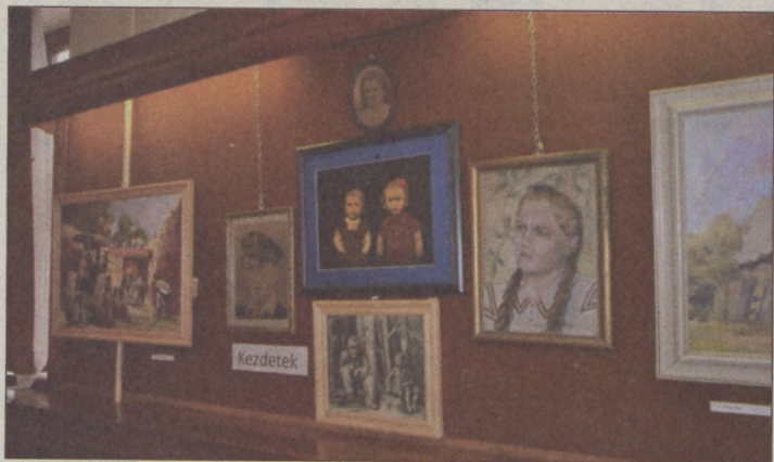
A kiállítás március 29-ig tekinthető meg a közösségi házban