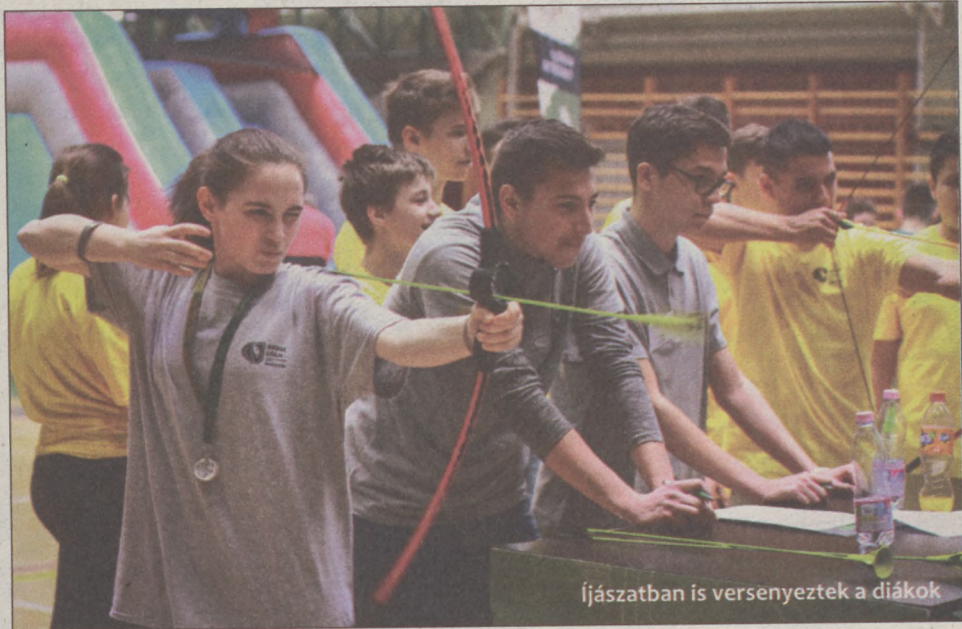
Íjászatban is versenyeztek a diákok

Az MNÁMK sportcsarnokában 10 órakor kezdődött a program, mellyel a Honvédelmi Sportszövetség célja, hogy a diákok – az aktív mozgás mellett – játékos formában új ismereteket