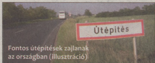
Fontos útépítések zajlanak az országban (illusztráció)

A Közlekedésfejlesztés Bács-Kiskun megyében I. elnevezésű projekt 4.047 millió forint uniós vissza nem térítendő támogatásból zajlik. Több mint 1,1 kilométeren vehették birtokba a közlekedők az 5501-es jelű utat. A közbeszerzési eljárás során kiválasztott Soltút Kft. mintegy nettó 64,5 millióból valósította meg a beruházást. A Kelebia-Baja összekötő út érintett szakaszának teljes körű felújítása során a burkolat profilmarása és bitumenemulziós felületkezelése után 2,5 cm vastag