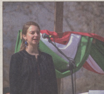
A Marosvásárhelyi Művészeti Líceum tanulója is műsort adott