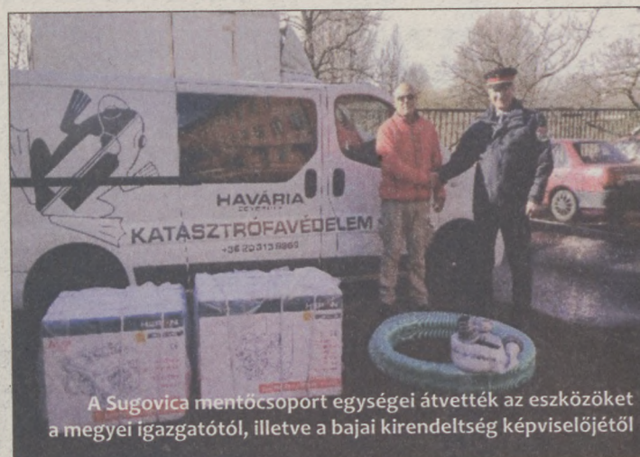
A Sugovica mentőcsoporthoz tartozó mentősök egy fehér kocsival, amelyen 'HAVÁRIA KATASZTRÓFAVÉDELME' és a telefonszám '+36 20 313 8865' van látható. A mentősök a kocsiból eszközöket emelnek ki.

KÖZLEMÉNY A Bajai Katasztrófavédelmi Kirendeltség területén két járási és három települési mentőcsoporthoz tartozó mentősök szakfelszerelése gyarapodott kárfelszámoláshoz használható eszközökkel. A mentőszervezetek képviselői ünnepélyes keretek között vették át az áramfejlesztőket, a hordozható szivattyúkat és a zagyszivattyúkat.