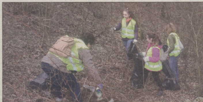
Mintegy 50 zsák hulladékot gyűjtöttek be a diákok