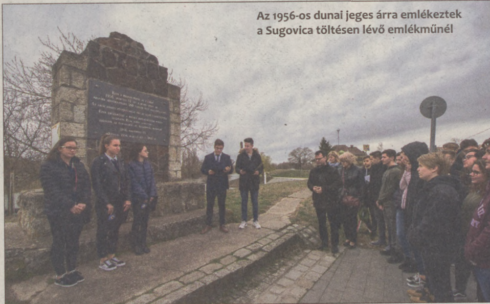
Az 1956-os dunai jeges árra emlékeztek a Sugovica töltésen lévő emlékműnél