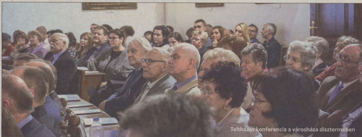
Teltházás konferencia a városháza dísztermében