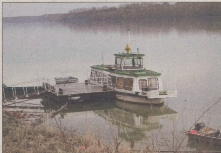
A komplexumhoz négy hajó is tartozik