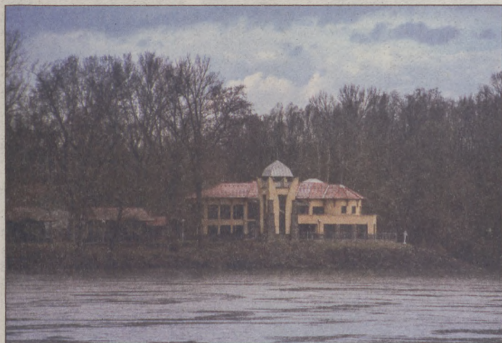
A veránkai üdülő a Duna jobb partján