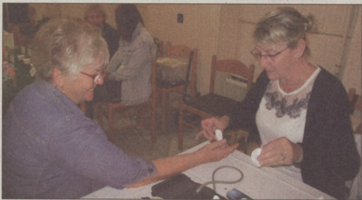
A május 25-i egészségnap sikeresnek bizonyult