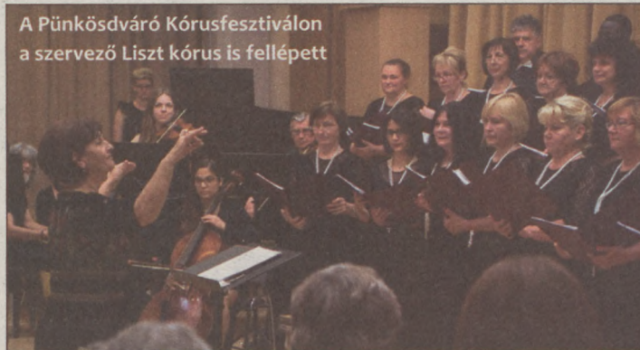
A Pünkösdváró Kórusfesztiválon a szervező Liszt kórus is fellépett