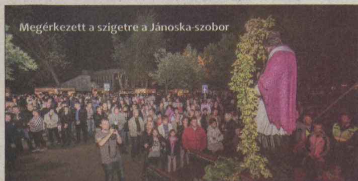
Megérkezett a szigetre a Jánoska-szobor