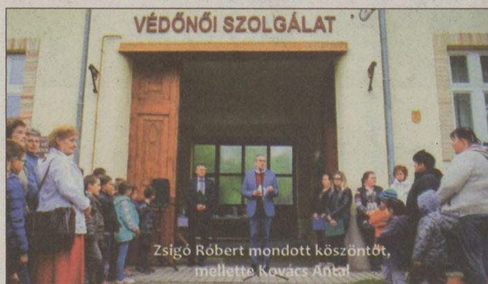
Zsigó Róbert mondott köszöntőt, mellette Kovács Antal

Az ünnepélyes átadón Zsigó Róbert államtitkár, Baja és térsége országgyűlési képviselője úgy fogalmazott: önmagunk és szeretteink egészsége a legnagyobb kincsünk, ezért nem mindegy, milyen környezetben gyógyulhatunk, ha baj van. – Magyarország kormánya elkötelezett a vidékfejlesztés mellett. Az elmúlt esztendőben sok településen tudtuk megújítani a rendelőkét és a védőnői szolgálatot. Kívánok mindannyiunknak még sok közös sikert!