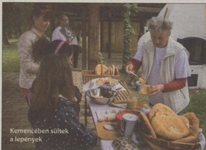
Kemencében sülték a lepények