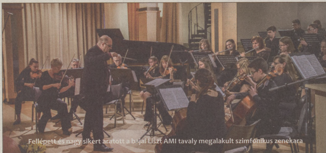
Fellépett és nagy sikert aratott a bajai Liszt AMI tavaly megalakult szimfonikus zenekara