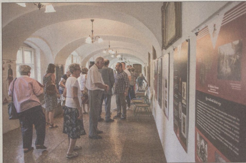
Kilenc pannon eleveníti fel a fejedelem életének legfontosabb mozzanatait, állomásait