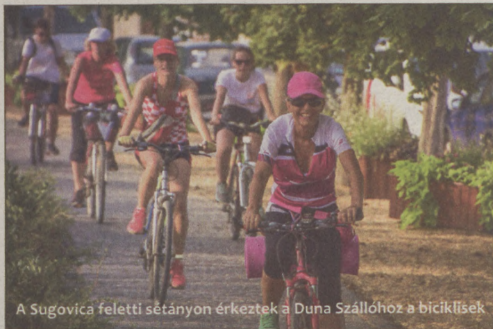
A Sugovica feletti sétányon érkeztek a Duna Szállóhoz a biciklisek