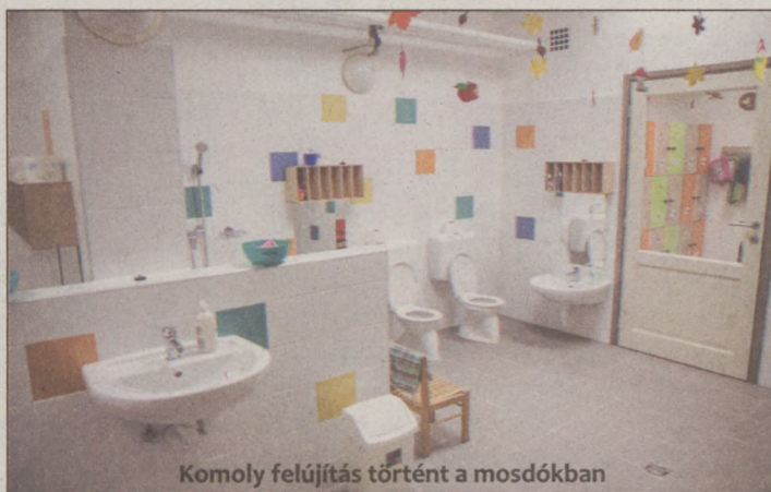
Komoly felújítás történt a mosdókban