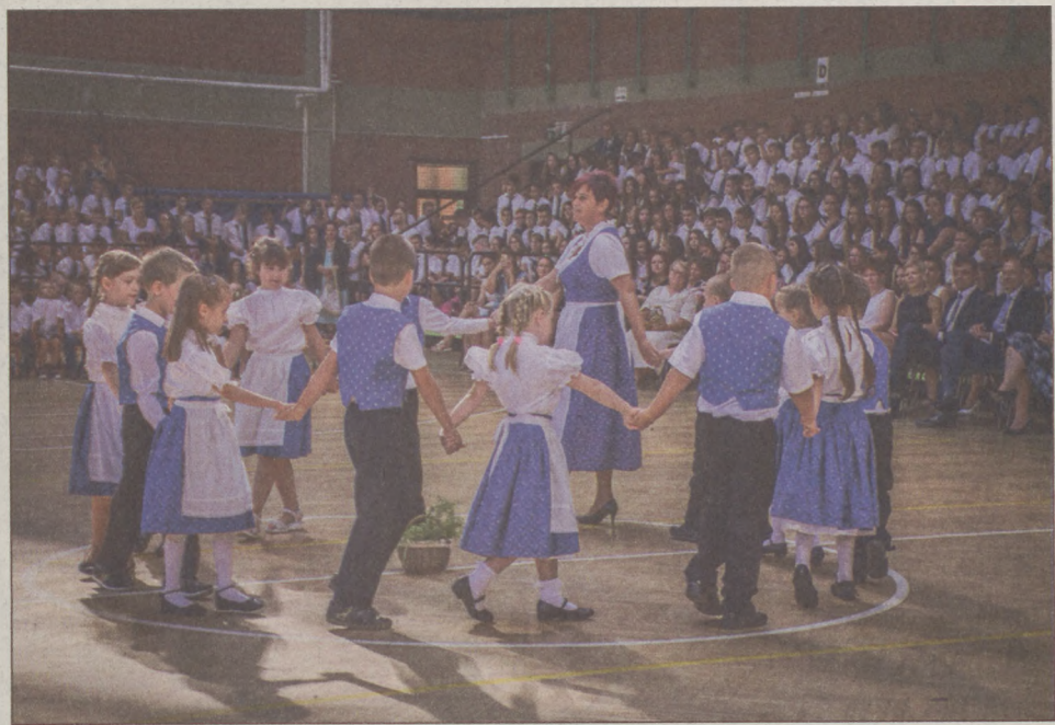
Az MNÁMK-ban is ünnepélyes tanévnyitóval kezdődött a tanév, felvételünkön az ovisok műsora