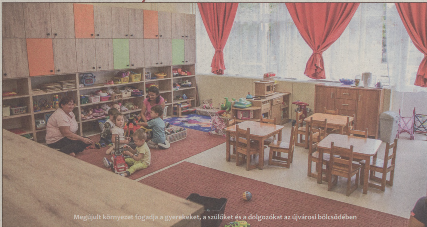
Megújult környezet fogadja a gyerekeket, a szülőket és a dolgozókat az újvárosi bölcsődében

ÚJVÁROS Megújult, barátságos, harmonikus környezet fogadja a kicsiket, a szülőket és a dolgozókat a Kodály utcai bölcsődében. A nyári felújítási munkálatok után szeptember 2-án átadták az intézményt, a végeredmény mindenki tetszését elnyerte.