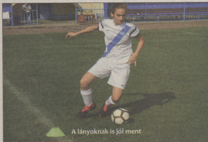
A lányoknak is jól ment