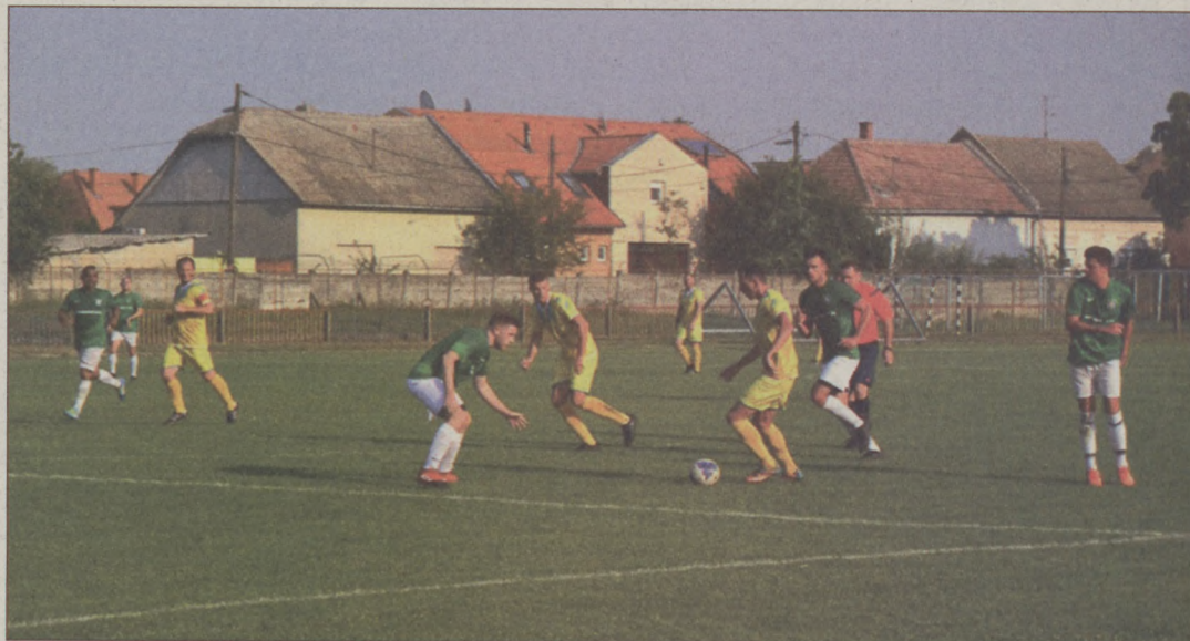
Megkezdődött a bajnokság: sok gól, jó meccs, jó hangulat az első találkozón