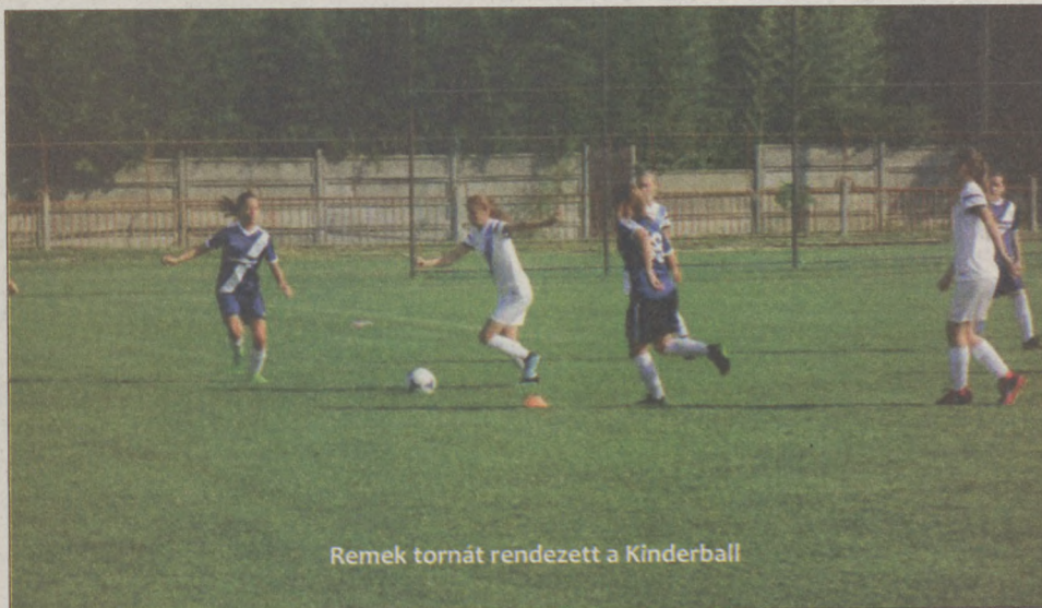
Remek tornát rendezett a Kinderball

A körmérkőzéses rendszerű tornán egész nap zajlottak a küzdelmek. A támogatóknak köszönhetően több egyéni díj is gazdára talált, sőt a mérkőzések között a játékosok a lövőerejüket is felmérhették egy külön erre a célra kialakított szerkezet segítségével. U11-ben a Szekszárd (gólkirály Polyák Kristóf (Kalocsa), legjobb játé-