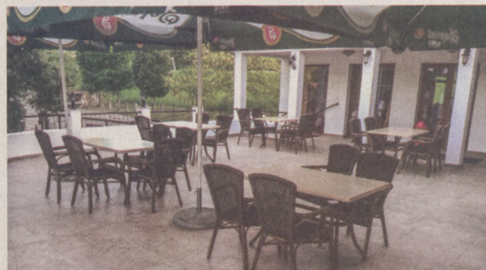
A Tanyacsárda vezetője szerint a kár havi milliókban mérhető