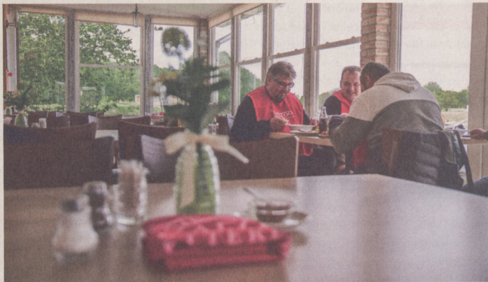
A Vízafogónak eddig közel 25 milliós vesztesége keletkezett