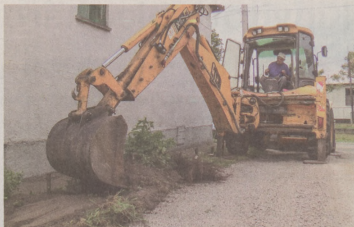
Szilárd burkolatot kap a Tavasz utca egy szakasza

– Mindannyiunk közös érdeke, hogy a város fejlődjön. Baján a helyi közutak, kerékpárutak építése kiemelt helyi közügynek minősül, erre tekintettel kérjük az útburkolat építés megvalósításához mindenki szíves türelmét és megértését – áll a közleményben.