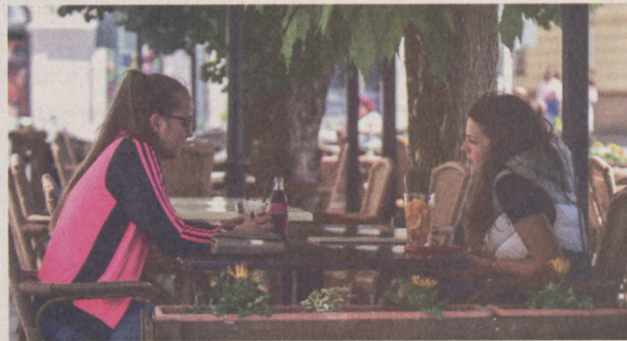
A Molának és a Sztendernek is hatalmas kárt okozott a forgalomkiesés