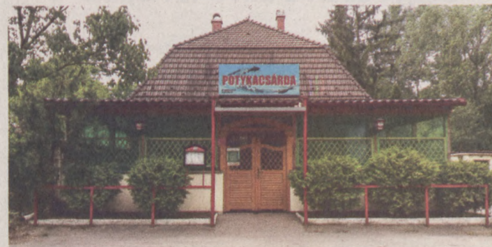
A Potyka üzemeltetői abban bíznak, visszaállhat a teljes üzemelés