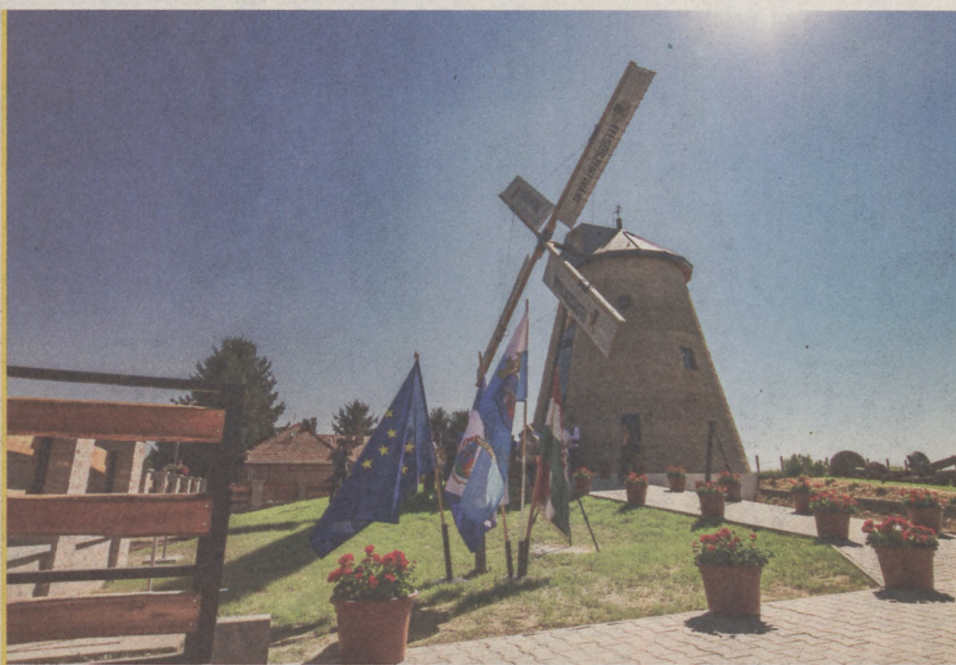
Megöröklték a megye búzáját augusztus 13-án, az újjáépített szélmalomban

Az épület több szintből áll, alagsorában egy 24,5 méteres, a malom történetét feldolgozó fotómontázs kap helyet, ezt augusztus 29-én