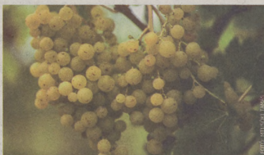
FOTÓ: ANTI-SOXI TAVASZ

Gemencben bögnek a bikák, ami szép, de vele elhal a nyár és hamarosan elhalnak a ma még hangos gímszarvasok is, mert most ennek jő el az ideje. Augusztus végét írjuk, a színem végre elérte a májusit, mert ez a nyár ilyen volt, néha az idő hiánya, néha a hőmérséklet, de főleg a Duna szabott gátat a napon szunnyadásnak, bőven adva vizet a medernek. Zátonyt alig láttunk, sokszor a Sugó homokját is csak a vízben éreztük talpuk alatt, az időjárás meg széles, de hát az időjárás mindig széles volt. Azért a nyár, az nyár, várjuk mindig, mert a diákkor semmittevése emlékeztet, vagy, ha munkás napokra is, semmiképp sem az iskolára, ami kevés diáknak volt kedvére. És már rég nem vagyunk diákok,