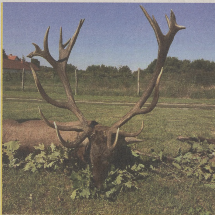
Kapitális bika került terítékre a Kékhegyi Vadásztársaság területén

Jó bikák azért estek az elmúlt napokban hazánkban, a Nimród beszá-