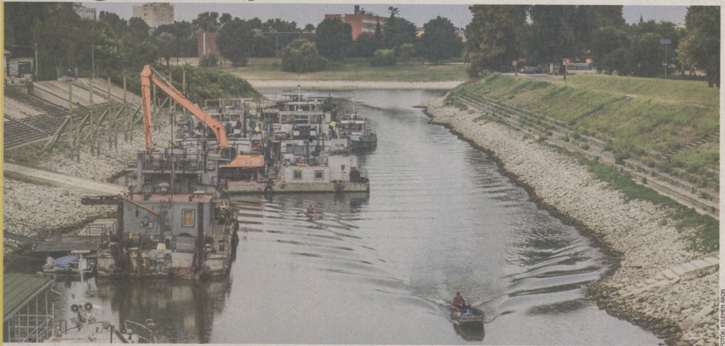
A Duna és a Sugovica mindig központi téma volt Baján, a városvezetés és a Víz tudományi Kar együttműködése ezért is fontos