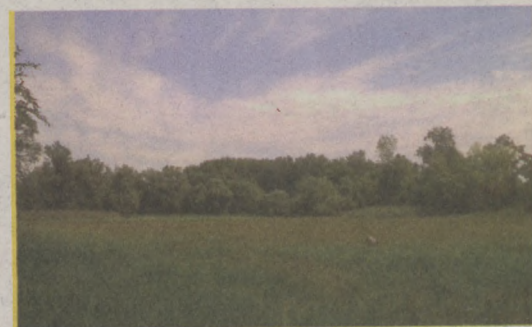
Gemenc az egyik kapocs a két város között