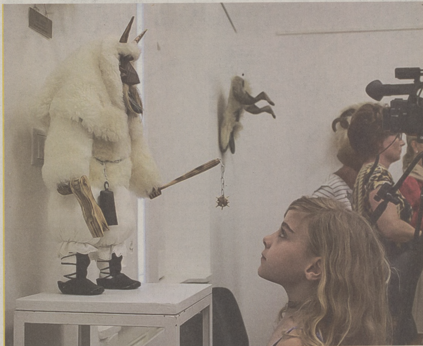
Busó maszkokból, babákból és kellékekből összeállított kiállítás látható szeptember 30-ig a Bácskai Horvátok Kulturális Központjában