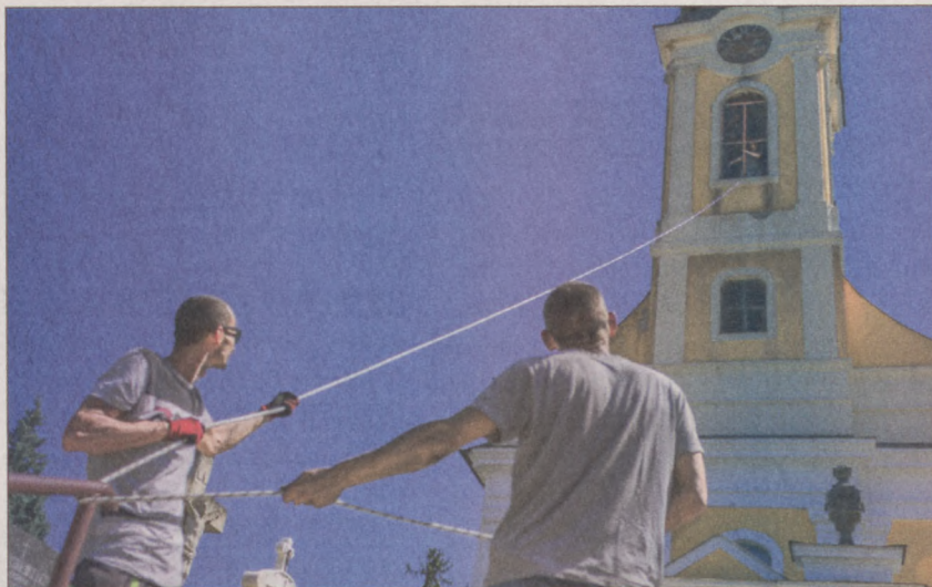
Kiemelték a nehéz ablakokat

– A torony festése alpin technikát igényel, ez a legkomolyabb munka, de javításra szorulnak a felázott párkányok is. A zsalugáteres ablakokat (amelyek egyenként legalább 200 kilót nyom-