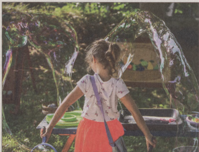
Gyermeknapon számos programmal várják a bajiakat.

Remek hír a családok számára: május 30-án, vasárnap rengeteg színes és változatos programmal várják a gyermekeket a Petőfi-szigeten.