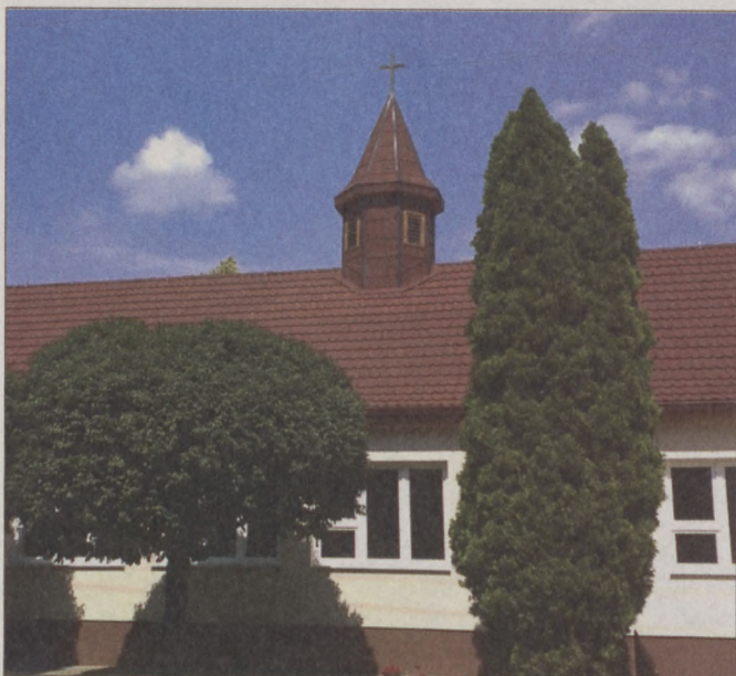
Számos fejlesztés történt Nagybaracs-kán