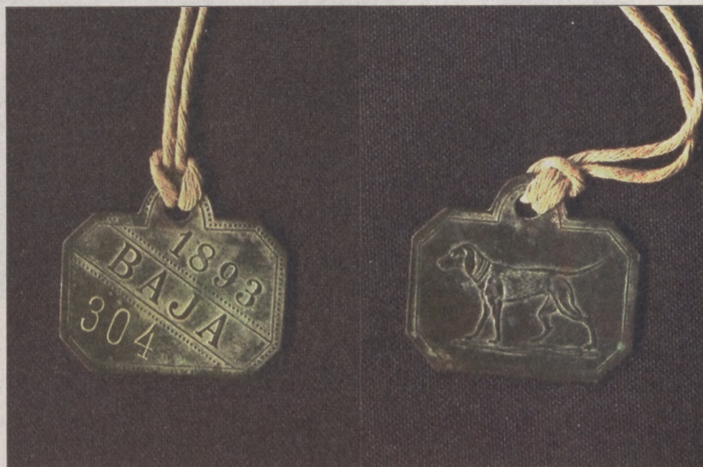
Mára ritkaságnak számít az ebbárca

Pillantsuk be együtt a bajai Türr István Múzeum kincses tárába. Új rovatunkban az intézmény munkatársai ajánlják olvasóink figyelmébe az állományukban fellelhető ritkaságokat.