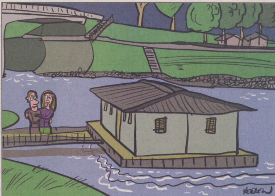
Úszóház a Sugovicán - Vajon a CSOK felvehető rá drágám?

GEMENC Először áll szolgálatba és várja utasait a teljes felújítása után pünkösdi hosszú hétvégéjén a Rezét gőzös. Vezetett gyalogtúra, lovas fogatozás, kézműves játékok, kiállítás, valamint kürtöskalács, méz- és lekvárkülönlegességek várják a kirándulókat a három napos ünnepen az erdőgazdaság Ökoturisztikai Központjában, Pörbölyön. Részletek: www.gemenczrt.hu .