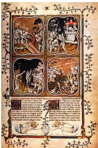
Az itt látható miniatúra Franciaországban készült, 1375 körül.

A mai konstruktivista megközelítések nézőpontjából azonban szokatlan lehet, egyrészt, hogy Szűcs megpendíti az érem másik oldalát is: nevezetesen, hogy a modern nemzet – bármennyire konstrukció is –, bizonyos mértékben mégiscsak épített a rendi nemzeti előzményekre is. 10 Másrészt – és ez Szűcs elemzésének legeredetibb gondolata, még napjainkból visszatekintve is – kimutatta, hogy a rendi nemzet(tudat) bizonyos mértékben éppúgy konstrukció eredménye, mint a modern nemzeti identitás; ráadásul mindkét konstrukció hasznosított korabeli nyugati mintákat is.