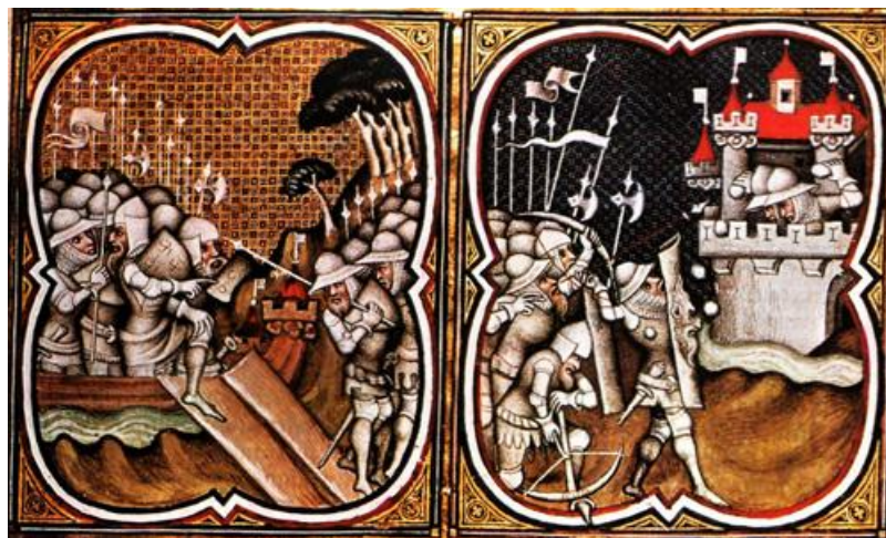
Az első két képkockán görögök által ostromolt Tróját láthatjuk...