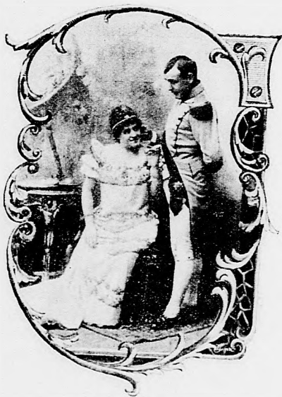
A KOMJÁTHY-PÁR mint Hübscher Kata és Napoleon.

Másnap álmatlanul ugyan, de teljes megnyugvással és mondhatni jó kedvvel jelent meg a színházi törvénykezésnél.