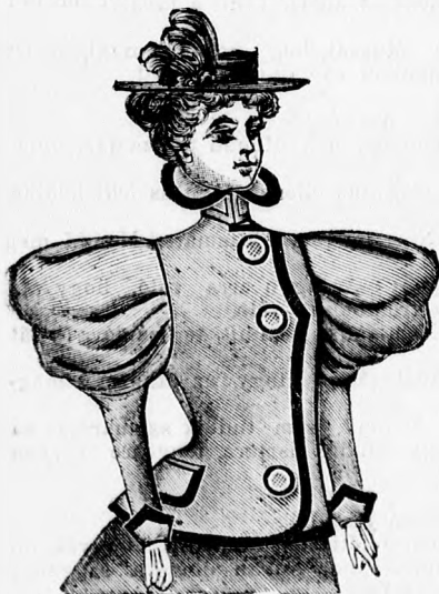
Elegáns téli kabát 7 frttól feljebb.

Vatirozott téli gallér 10 frttól feljebb.