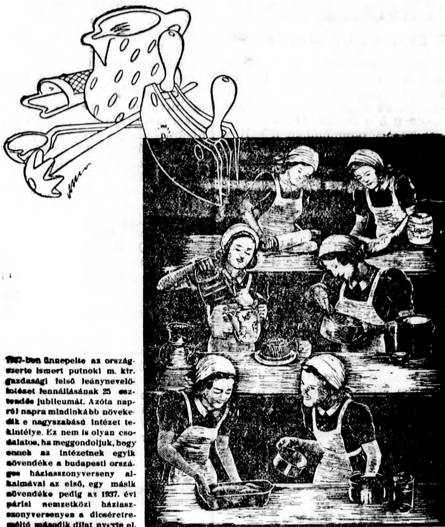
1937-ben ünnepelte az ország-szerető ismert putnoki m. kir. gazdasági felső leánynevelő-intézet fennállásának 25. évforduló-jubiläumát. Azóta napról napra mindinkább növekedik a nagyszabású intézet tekintélye. Ez nem is olyan csodálatos, ha meggondoljuk, hogy ennek az intézetnek egyik növendéke a budapesti országos háziasszonyverseny alkalmával az első, egy másik növendéke pedig az 1937. évi párizsi nemzetközi háziasszonyversenyen a díszéremmel jutalmazott második díjat nyerte el.

A nagy kutató és tudós életének lenyűgöző hatású regénye. A velencei nagydíjjal kitüntetett Tobis me-termé. Legújabb Magyar Világhíradó! És kizárólagos joggal csak nálunk METRO VILÁGHIRADÓ! Előadások kezdete: 5, 7 és 9.