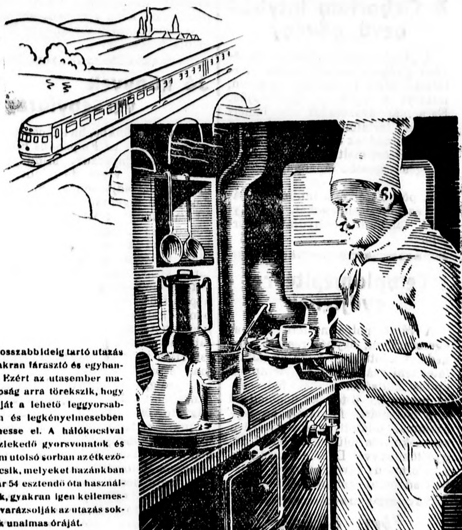
A hosszabb ideig tartó utazás gyakran fárasztó és egyhangú. Ezért az utasember manapság arra törekszik, hogy célját a lehető leggyorsabban és legkényelmesebben érhesse el. A hálókocsival közlekedő gyorsvonatok és nem utolsó sorban az étkezőkocsik, melyeket hazánkban már 54 esztendő óta használnak, gyakran igen kellemesé varázsolják az utazás sok-sok unalmas óráját.

HA mindennapi kenyérkereső munkáját nyugodtan és jól akarja végezni, akkor gondoskodjék mindenekelőtt arról, hogy bélműködése és anyagcsereje rendben legyen, amit pedig úgy érhet el, hogy reggelenként felkeléskor egy kis pohárnyi természetes FERENC JOZSEF keserűvizet iszik. Kérdezze meg orvosát!