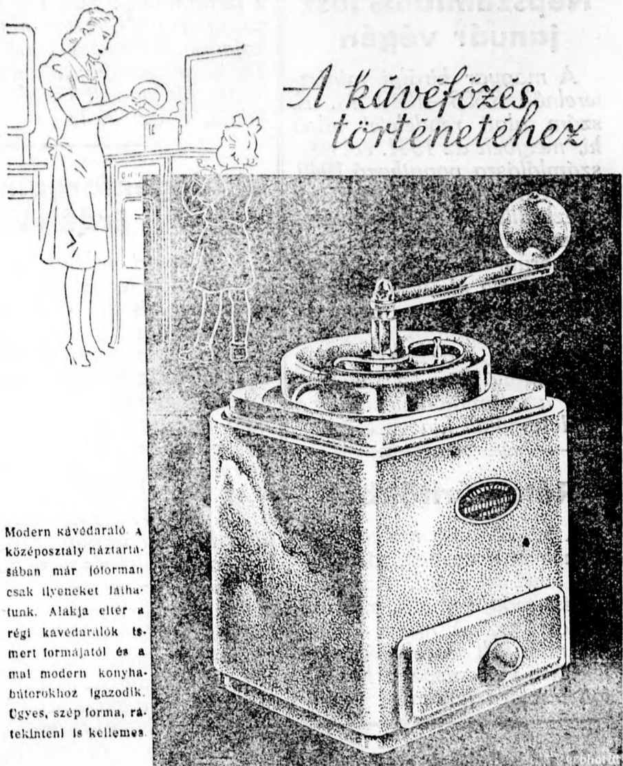
Modern kávédaráló. A középosztály háztartásában már jótörten csak ilyeneket láthatunk. Alakja eltér a régi kávédaralók tismert formájától és a mai modern konyhabútorokhoz igazodik. Gyöngy, szép forma, rátekinteni is kellemes.

Szombaton: 5, 7 és 9 ó. Vasárnap: 3, 5, 7 és 9 ó. Siley Temple Aktuális Híradók: