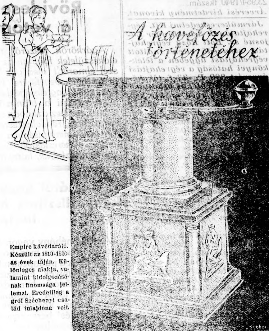
Empire kávédaráló. Készült az 1810-1820-as évek táján. Különleges alakja, valamint kidolgozásának finomsága jellemzi. Eredetileg a gróf Széchenyi család tulajdona volt.

HUNGARIA MOZGÓ Szombaton: 5, 7 és 9 óraker, vasárnap: 3, 5, 7 és 9 óraker: A FEKETE ASSZONY