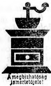
A megbízhatóság jelszeritője!

1828 óta viseli dobozán a Franck -kávépótlék a megbízhatóság jelét: a kávédarálót. Azóta is mindig, mint szemnek és száznak kedves, igazi érték szerepel ez a gyártmány a fogyasztók előtt. És méltán! Sötétebb színt, kiváló ízt és tökéletes finomzatot ad mindennapi kedves kávéitalunknak a