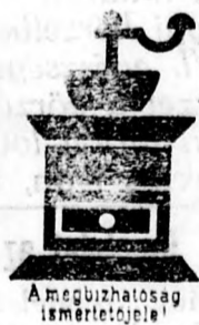
A megvizsgálás igazolójaként

A másik az a kávédaráló, amely a Franch -cikóriakávé jólismert kék-barna dobozán látható. Ez is ajánlatos, mégpedig minden kávéitalhoz! Ez adja szép, sötétbarna színét, különleges, tökéletes ízét és azt a kiváló zamatát, amely mindennapi kávékat előttünk olyan kívánatosá teszi. Ha csak rá gondolunk, máris érezzük annak pompás illatát.