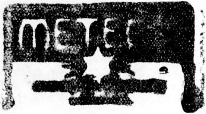
Csütörtökön, István király napján:

A kivonult mentők kiszállították a sebészeti klinikára, ahol eltört lábát gipszbe tették.