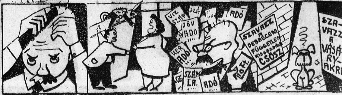
(Az események gyors zajlása következtében könnyen lehet, hogy a két utcasarok közt választó kiskutya gondjait lapzártáig megszüntetik. Ugyanis a Szabadságpárt felosztása minden pillanatban várható.)