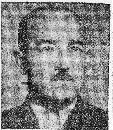
partizánharcosok közt emlegetik nevét.

A háborúban, mint 15 évi feyházra ítélt politikai foglyot börtöncsaláddal kiviszik a frontra, átszökik a Vörös Hadsereghez s csakhamar a leghíresebb magyar