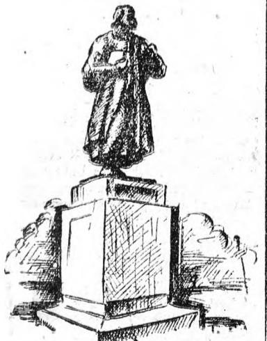
Méliusz-Juhász Péter szobra