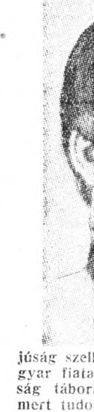
Jóság szelgyar fiatal ság tábor mert tudó