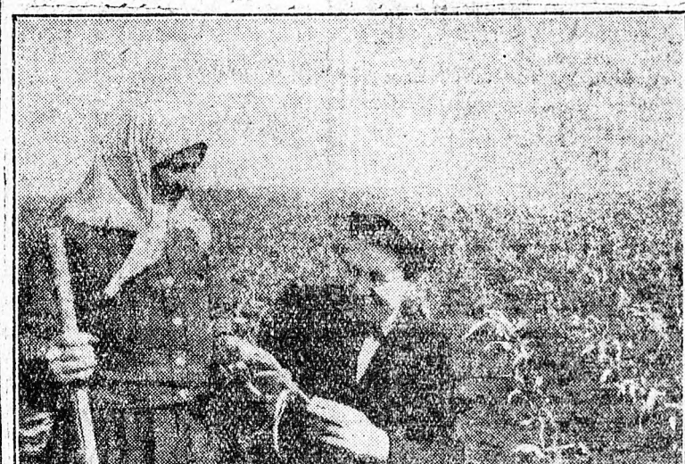
Ít az eredmény: A kolhoz egyik munkacsoportjának vezetője örömmel, mosolyogva vizsgálja a jól fejlődő termést. Az öntözés megadta a magáét, a kolhoz munkáját ismét s-ker koronázza, tovább gyarapodnak a kolhoz parasztjai. Hát meg, ha a búzatermés is beér.