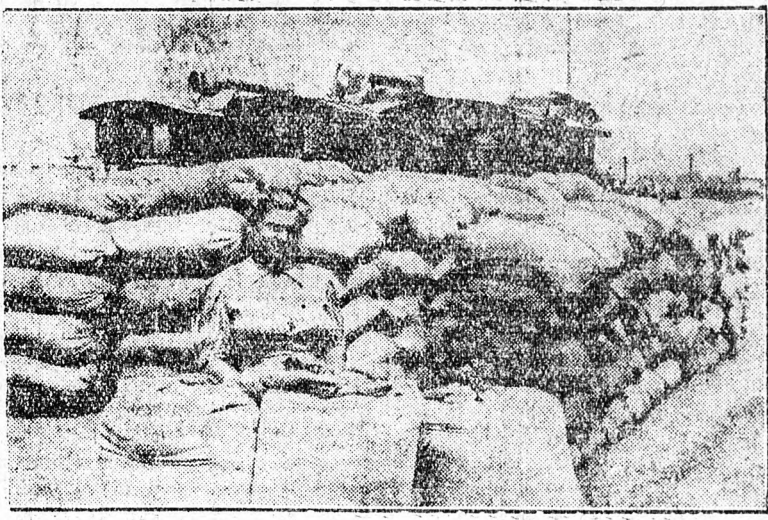
Jó gazda legnagyobb öröme a tiszta, nemesített, bő-termést ígérő vetőmag. A Szovjetunó fejlett mezőgazdasága lehetővé teszi, hogy tavasszal olyan kifünő vetőmag kerüljön a földbe, ami már eleve biztosítja a jó-termést. Képünkön egy Moszkva környéki kolhozban a vetésre előkészített vetőmagot láthatjuk.