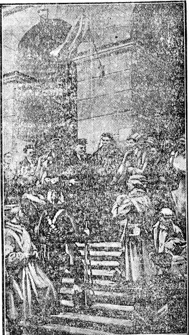
Október Szmolniban I. Osznyev festménye

kus Köztársaság ideiglenes kormányának nevében köszönetét fejezte ki Csujkov elvtárs, hadseregtábornoknak az internálótáborok feloszlására vonatkozó közléseért. A hadbírósg által elítélteket büntetésük kitöltése végett a Német Demokratikus Köztársaság belügyminisztériumának adják át. Az egész német sajtó örömmel üdvözli a három tábor megszüntetését és a német nép nevében hálás köszönetét tolmácsolja a Szovjetunió nagylelkűségéért.