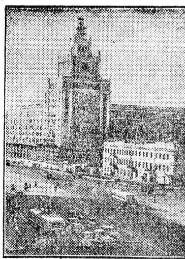
Ezen a képen egy húszemeletes épület már összeszerelt acélvázat láthatjuk. A gyönyörű épület moszkvai Szmolenszk-tér dísz