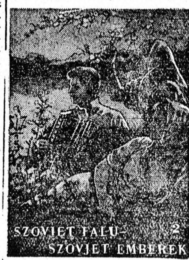
SZOVJET FALU — SZOVJET EMBEREK

ismerhetik a szovjet falut. Pártunk népevelői e füzet jó terjesztésével járuljanak hozzá, hogy dolgozó parasztságunk mindjob-