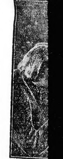
Az egységes... tagjai vidám... padok mellett... brigádnak, am

A Szovj... éves terv... kenység... emelkedés... szovjet d... ezt az elő... lista munk... a sztahan... sztahanov... lentkezés... nyezések... Dimitrij... „Borjec”-... dolgozik... vevője a... senynek és