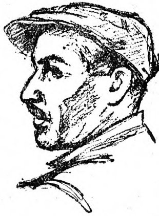
helyes utat, amelyet a Szovjetunió mutat, vezet bennünket a végső diadal felé.

mi Pártunkat is és dolgozó népként szeretett vezérért, Rákosi elvtársat, aki felismerve azt a