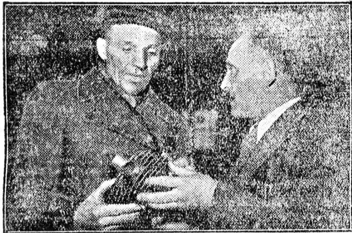
Amint látjuk, a sztahanovista öntő egy motoralkatrészt vizsgál figyelmesen a csepeli gyárban.

gyár tele volt a Gestapo titkos ügynökeivel, az üzemek között vezető utakra a rendőrség mindegyikét betonállásokkal épített, ezeket megrakták ágyúkkal és gépfegyverekkel. A műhelyekben naponta tucatjával tartóztatták le a munkásokat. De a földalatti kommunista szervezet mégis folytatta munkáját.