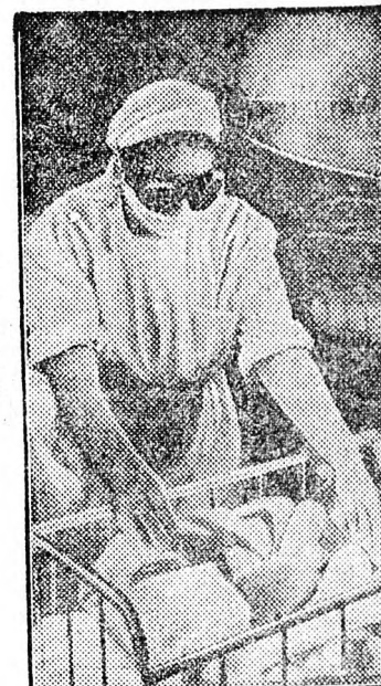
A moszkvai Klara Zetkin szülőotthon egyik újszülöttjét Karacéni kezelésben részesítik. A legmodernebb egészségügyi eszközökkel segítik a gyermekek egészséges fejlődését.