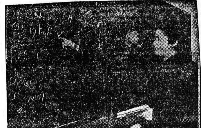
Az Urabnas gépgyárban mindenki tanul, az ifjú munkásokat különben képezik ki. A szükséges elméleti oktatást esti iskolán kapják.