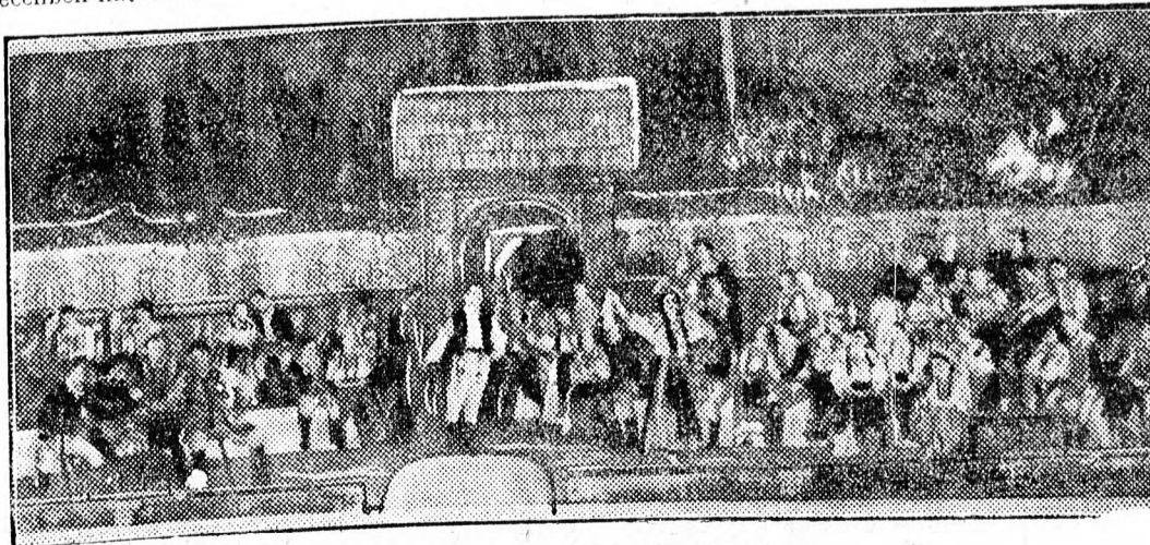
A „Székely fonó” egyik jelenete

A küldöttek a moszkvai sajtóban beszámolnak az országban mindenütt tapasztalható hatalmas lelkesedésről és termelési fellendülésről. Jagogyin, a kelet-szibériai vasút ulan-udei mozdonyvezetője a Pravdában megírja, hogy a kelet-szibériai mozdonyvezetők minden egyes brigádja harcászál a napi 500 kilométeres teljesítményért. A szocialista verseny résztvevőit lelkesíti az a tudat, hogy munkájukkal hozzájárulnak a békekért vívott nagy küzdelemhez. Szamszonov, a moszkvai környéki Ijuberci mezőgazdasági gépgyár munkása az Ivesztijában a mezőgazdasági gépgyártás újabb sikereiről ír. A szovjet munkásoknak meggyőződésük — írja Szamszonov —, hogy a Legfelső Tanács ülésének határozatai elősegítik a népgazdaság további fejlődését és új sikereket teremtenek a kommunizmus építésében.