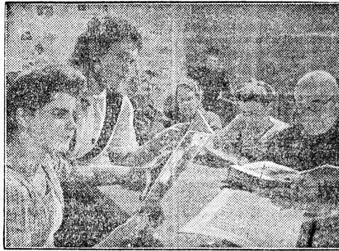
A krasznodarvidéki Uzsty-Lavinszkaja telep kultúrházának olvasótermében a Micsurini tudományokkal foglalkozik fiatal lány és öreg kolhozparaszt egyaránt. A legújabb szakfolyóiratokat tanulmányozzák át, hogy az itt szerzett tudással is javítsák munkájukat és növeljék az eredményeket.