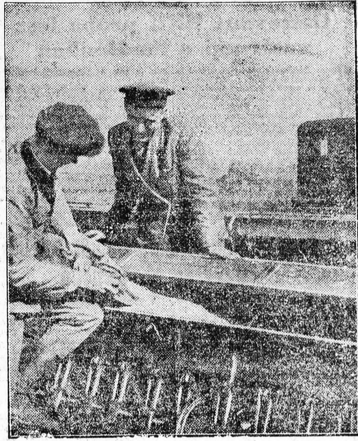
A kolhozok és szovhozok dolgozói fokozódó lendülettel végzik az őszi szántást és vetést. Az ukrainai „Proletár” kolhozban örömtől ragyogó arccal nézik a kolhozparasztok, hogy ömlik a nagyszemű búza a vetőgépre.