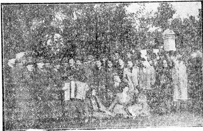
A rendőrség kultúrcsoportja csasz-tuskákat énekel