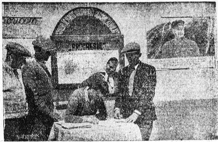
A Román Népköztársaság 10,047.670 állampolgára írta alá a Béke Hívei Állandó Bizottságának felhívását. Képiükön a turnisori (Sibiu megye) „Zorille” kollektív gazdaság dolgozói, amint a stockholmi telhívást aláírják.