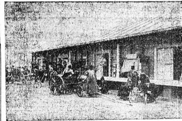
A Buzua megyei „Badeni-Milnite”, község szövetkezetének gépköleszöraktára