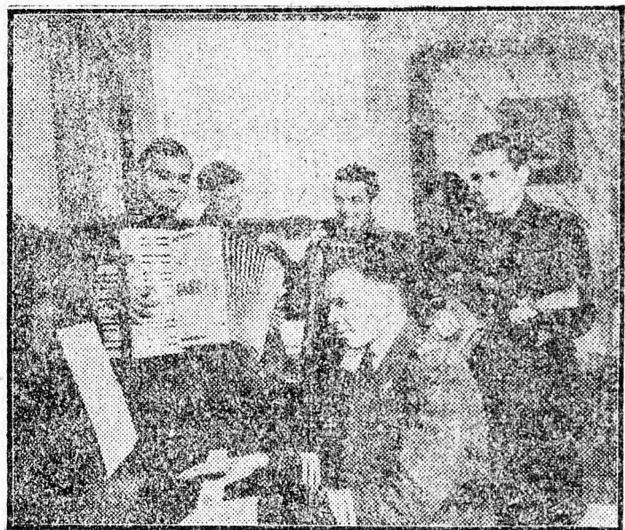
A népi demokráciák hadseregei mintaképük, a dicső Szovjet Hadsereg példáját követve, növelik erőiket és szilárdan öröködnék a békavárat. A lengyel légierők tisztiiskolájában nagy kultúrunka folyik. Képviseletként a zenekar, fellépése előtt próbát tart.

A hideg szél felborzolta a Csendes-óceán sűrű ködöt és sűrű ködöt a Parti Hegység felé. Ingerkedve tépte meg a város déli részén elterülő bányásznegyed rozsanó, düdülő kőmennyü vízkőit, s mint valami hajnali ébresztő, belépett a falak repedéseibe, az ablaküvegekbe, az ajtókeretekbe. Nem állt meg a szobákban, hanem a fájó fájó bebájt az ócska takaró alá és felzavarta az álmokat.