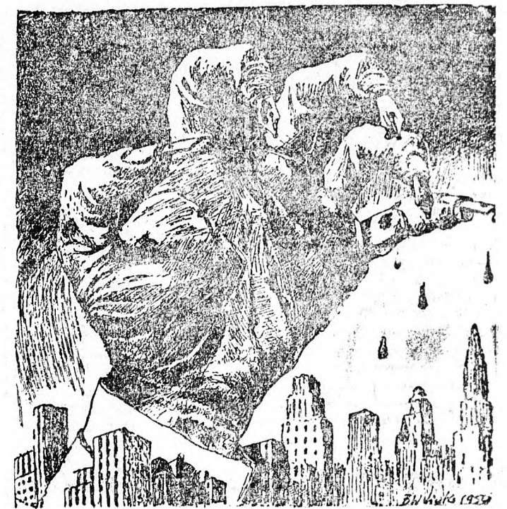
Az amerikai reakciós sajtó vesztül szítja a háborús hszte- riát (ujszághír).