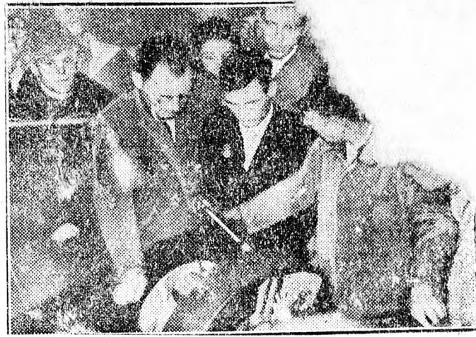
Pável Bikov, a világhírű sztahanovista szovjet gyorsvágó átadja értékes tapasztalatait és munkamódszerét egy üzem dolgozóinak.