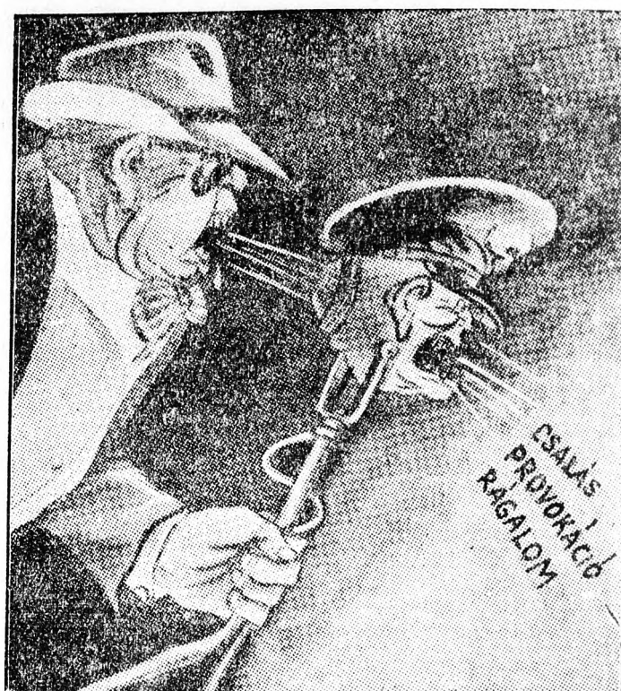
Az amerikai kém, a véreskezű Tito ma már egészen nyíltan, mint az amerikai háborús gyújtogatók habzószájú ügynöke lép fel. A belgrádi rádió mikrofonján keresztül a Tito-banda amerikai gazdáinak hazugságait kürtöli világgá.