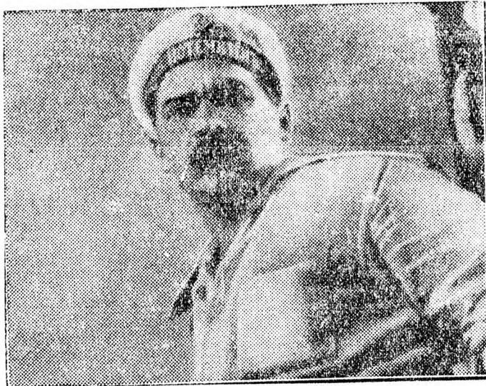
Antonov, a „Potjomkin páncélos” egyik szereplője

Ez a rövid hír jellemző az angol kapitalisták profitéhségére és lelkiismeretlenségére. A szenzáció és az üzlet kedvéért a tudományt nem állítják ilyen aljas célokra használni. Az emberek hiszékenységével visszaélve, ódi babonákat terjesztenek és még a családól sem riadnak vissza. Az angol lapok képtelése szerint három televíziós gépet állítanak fel abban a szobában, ahol a szellem „időnként megjelenik” és ultravörös sugarakat alkalmaznak, hogy a „körönlakati” jobban leheszen látni.