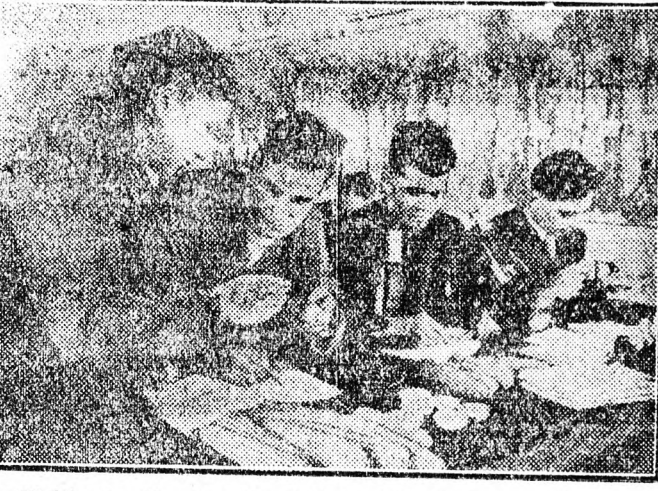
A Moldován Szovjet Szocialista Köztársaság kolhozaiban nagy eredményekkel folyik a tömeges oktatás. A kép a társzpoli kolhozvezető káderképző iskolában a gyakorlati foglalkozást mutatja be.