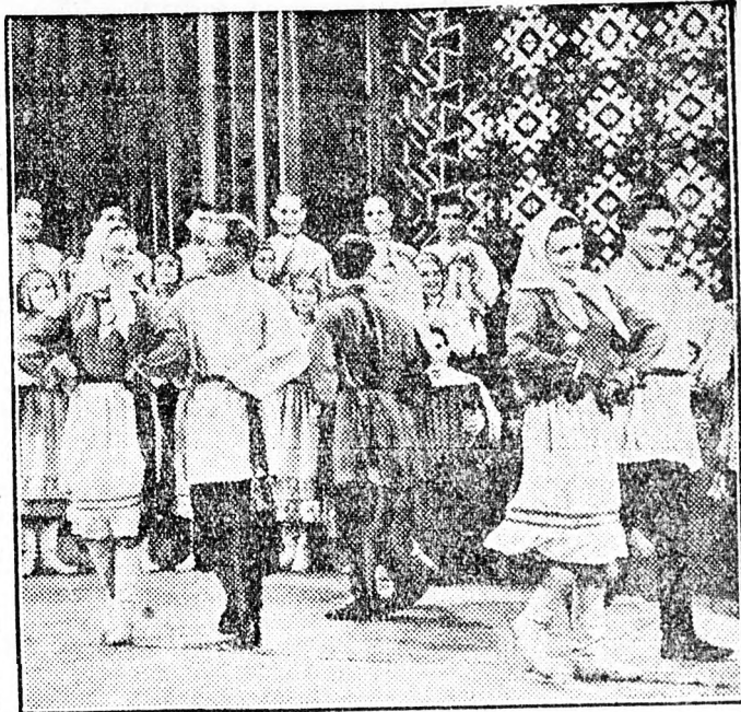
Nagy sikerrel zajlottak le a csuvas irodalmi estek Moszkvában. Ez volt a csuvas írók első fellépése a szovjet főváros dolgozói előtt, a szakszervezetek székházának oszlopcsarnokában. Az estet hangverseny zárta be, amelyen csuvas ének- és táncgyűttes nemzeti táncot adott elő.