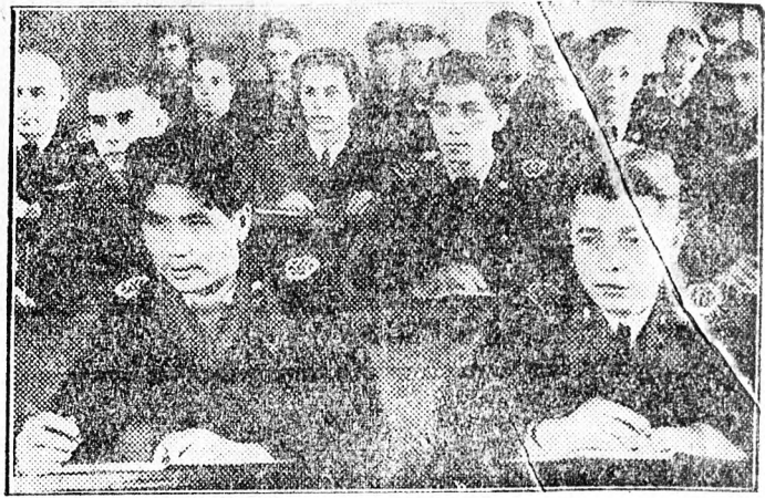
A szovjet bányászati eredményei világraszólóak. Az új szovjet ember, munkás és mérnök, hazafias lelkesedéssel dolgozik és tanul hazája felvirágoztatásáért. Képünk a szovjet bányászati iskola hallgatóit ábrázolja, akik igen magasfokú szakmai képeztést kapnak.