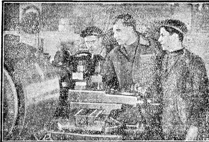
A népi demokráciákban nagy gondot fordítanak az ifjúmunkás káderek képzésére. A képzésükön éppen azt látjuk, hogy a bukaresti „Dinamo” villanymotorgyárban az ifjúmunkások megtanulják, hogyan kell kezelni a gyár számára érkezett új szovjet gépeket.