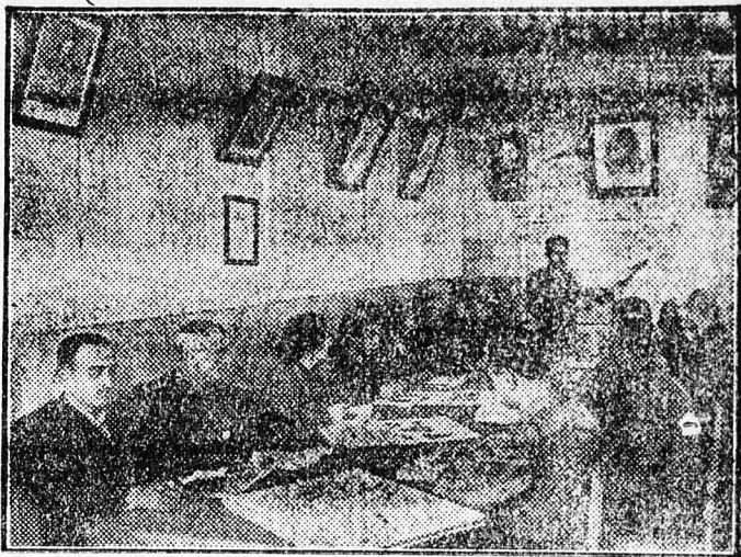
A Szovjetunióban milliók tanulmányozzák a Bolsevik Párt nagy vezérének, Leninnek és Sztálinnak életrajzát, hogy így emeljék elméleti képzettségük színvonalát. A képen a Gruz Szovjet Köztársaság Majakovszkoj kerülete Bagradzeröl elnevezett kolhozban a Lenin és Sztálin életrajzát tanulmányozó egyik kör tagjait látjuk tanulás közben.