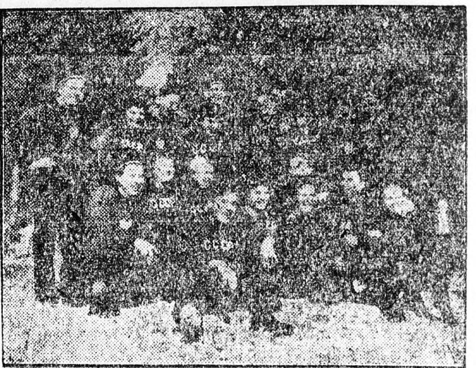
A képen egy magyar és szovjet sportolók által csoportot látunk a téli főiskolai bajnokságokon a romániai Fojanában

bi nemzetek fiataljainak is. Adták tudásukat és ezzel hozzájárultak a többi országok sportkultúrájának fejlesztéséhez.