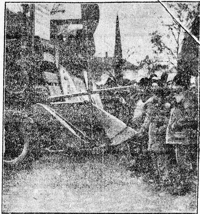
Képünkön az egyik mezőgazdasági gépet látunk, amelyet megkeresztése után nagy örömmel vesznek körül a dolgozó parasztlak.

Mint ismeretes, Rákosi Máttyás elvtárs nemrégiben meglátogatta Túrkevét. Rákosi elvtárs látogatása után megjelentek a túrkevei utcákon a legújabb mezőgazdasági gépek, amelyeket a kevei dolgozó parasztlak, Rákosi Máttyás gépeinek” kereszteltek el.