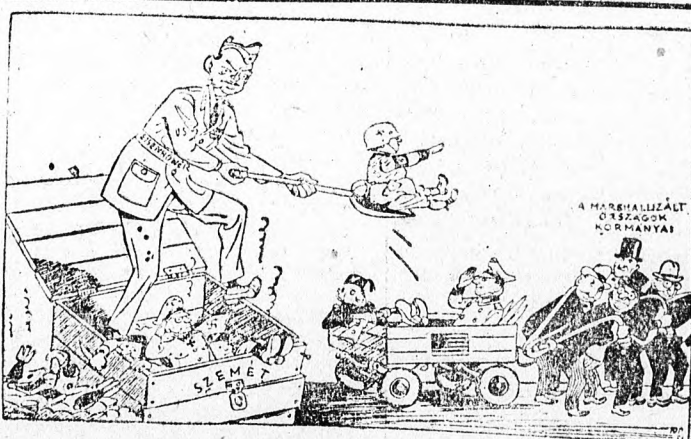
Eisenhower európai küldetése.

Az új fegyvertartási engedély kicserélésére vonatkozó bejelentés a lakóhely szerint illetékes rendőrőrsön kell teljesíteni. Egy fényképpel egy darab 4x4 cm-es fényképpel is be kell nyújtani.